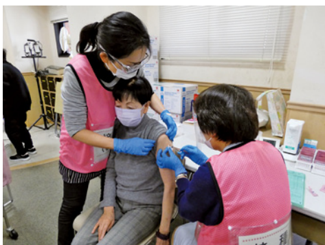
▲3回目ワクチン接種の様子

新型コロナウイルス感染症が再び急拡大する中、引き続き速やかに3回目のワクチン接種事業を実施するため、令和4年2月3日に専決処分されたものです。