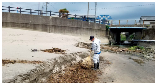
▲環境整備員による堺川河口付近のごみ回収の様子

A 景観美化の推進や河川水質の環境改善対策、公衆トイレ等維持管理のほか、ごみ処理の適正な管理や清掃センターの整備等の予算が組まれています。