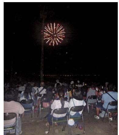
▲浜駐車場での町民観覧席の様子 (平成 30 年度)

A 観光振興推進事業補助金 640 万円の中に花火大会の経費を計上しています。開催の中心となる観光協会から実施について具体的に伺っていませんが、感染状況を見据えながら必要な協議を進めていきます。