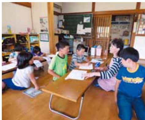
▲放課後児童クラブの様子

この条例は、児童福祉法の一部改正により、放課後児童健全育成事業における児童の対象年齢が「おおむね10歳未満」から「小学校に就学している」に拡大されたため、御宿町放課後児童クラブの設置及び運営に関する条例の一部を改正するものです。