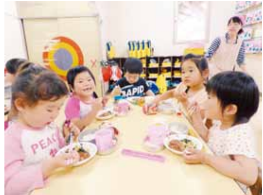
▲御宿保育所 給食の時間

体操服やジャージの購入など、小中学校に入学する際の準備費用の一部を町で補助し、保護者の負担軽減を図ります。