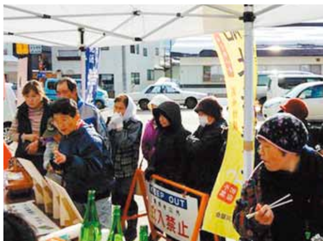
▲野沢温泉村で行われた物産交流

野沢温泉村物産品の町の販売企画も含めて、今後の実施について協議をしていきたいと思