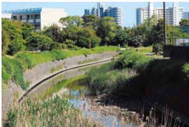
▲町内を広範囲にわたって流れる清水川

の点検状況ですが、浄化槽は人槽に応じ、点検周期が定められており、各施設において基準に従って実施されていると判断しています。民間事業所の実施状況は、現行制度では行政機関による実態把握は困難な状況です。県の関係機関とも連携を図りながら、利用者への啓発を行い、水質環境の維持向上に努めていきたいと考えています。 (答弁者：建設環境課長)