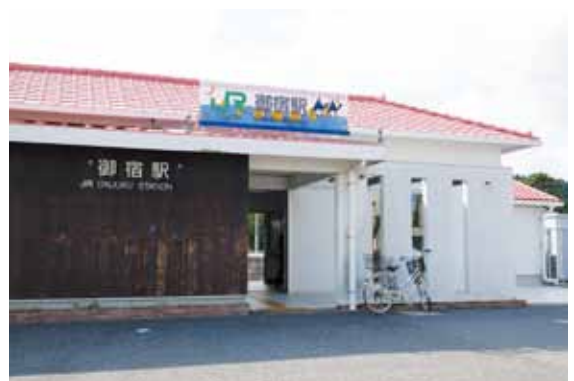
▲ JR 御宿駅

Q 20年分の維持管理費、修繕費用まで初期投資額に含むと、1億円、2億円の話でなくなってくるわけです。何よりも一日に、どのくらい使うのかの市場調査を実施し、駐車場も含め、総合的な駅の考え方をしないと、エレベーターだけ設置して、利用客はいませんということにもなりかねません。実際に数字で住民の皆さんに示していく。測量調査をして、設置の金額がこれぐらいでしたが、なかなかできません。済まないのではありませんか。またなぜ、自前で測量をしなければならぬのか伺います。