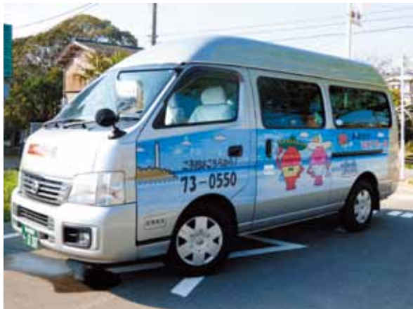
▲御宿町乗合運行 エビアミー号

Q 御宿駅エレベーターですが、一般社会では新たな事業を展開するとき、市場調査、実態調査を行います。利用者の動向分析をぜひ実施して、実態の把握をしていただきたいと思います。