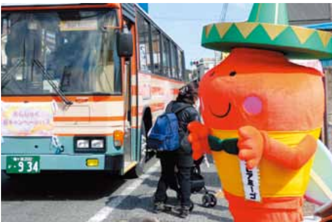
▲おんじゅくまちかどつるし雛めぐりとかつうらビッグひな祭りの両会場を結ぶシャトルバス

と比べると、なかなか想定しにくい、決めがたい状況だと思います。シャトルバスは実施したいと考えています。会場をどこにするかということについては、関係者の皆様方の広いご意見をいただきながら決定していかねければならないと考えています。 (答弁者：町長)