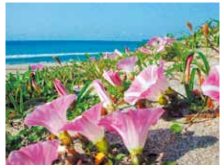
▲海岸に咲くハマヒルガオ

A 私の認識と違っておられますので、申し上げさせていただきますが、昨年9月頃に発生した浜崖については、災害の適用ということで、大きく分けると自然環境・景観の保全と災害対策を中心とした内容が出たわけです。私の考え