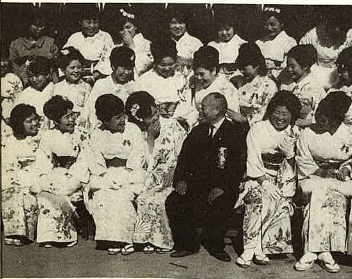
20才の女性に囲まれて。40年1月、成人式の日。