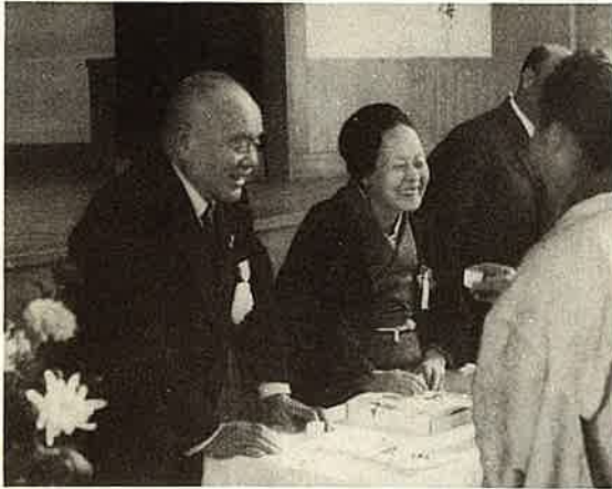
勲五等双光旭日章受章祝賀式の日。 右はさく夫人。四十年十一月