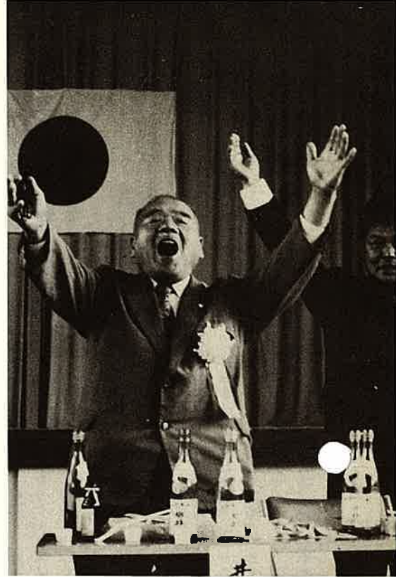
新旧町長の歓送迎会で万才をさげぶ、井