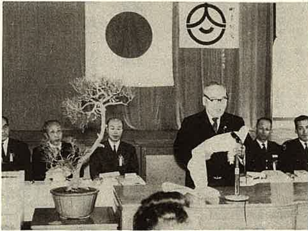
合併十周年記念式典でのあいさつ。40年3月。