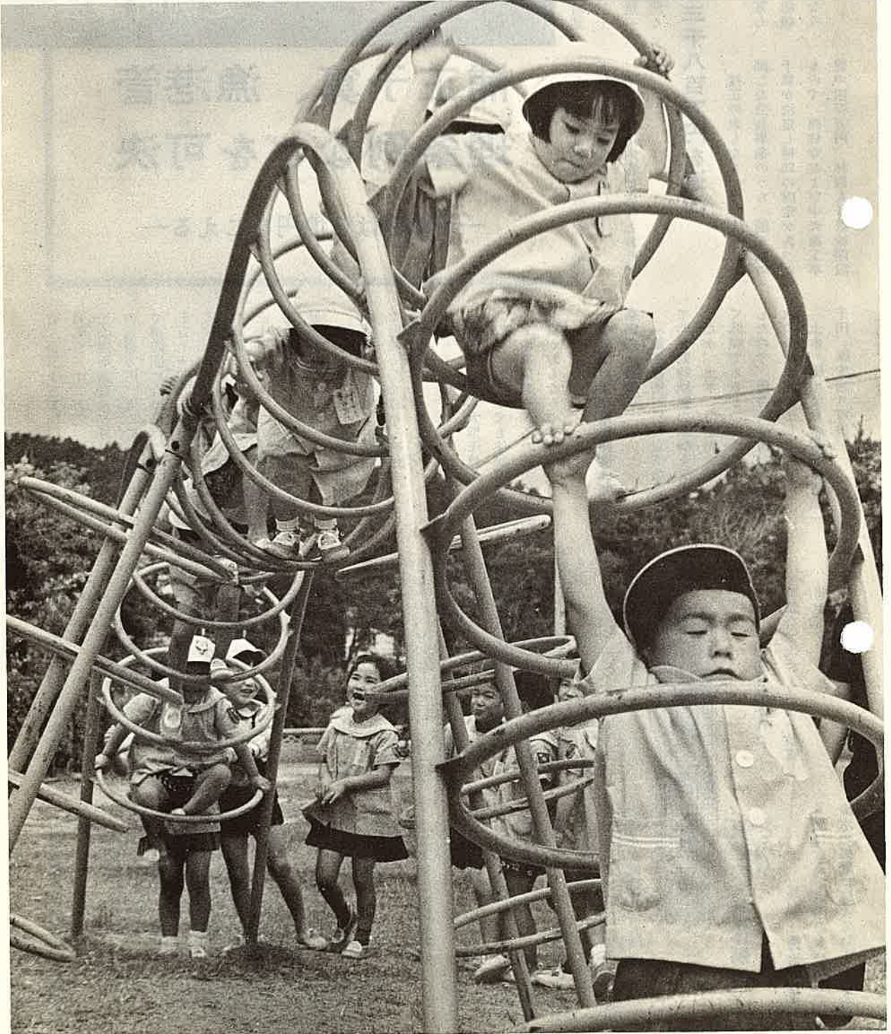
真剣な顔でつぎつぎに輪をくぐる 最後はうーんと背のびしてー ああよかった (第一保育園にて)