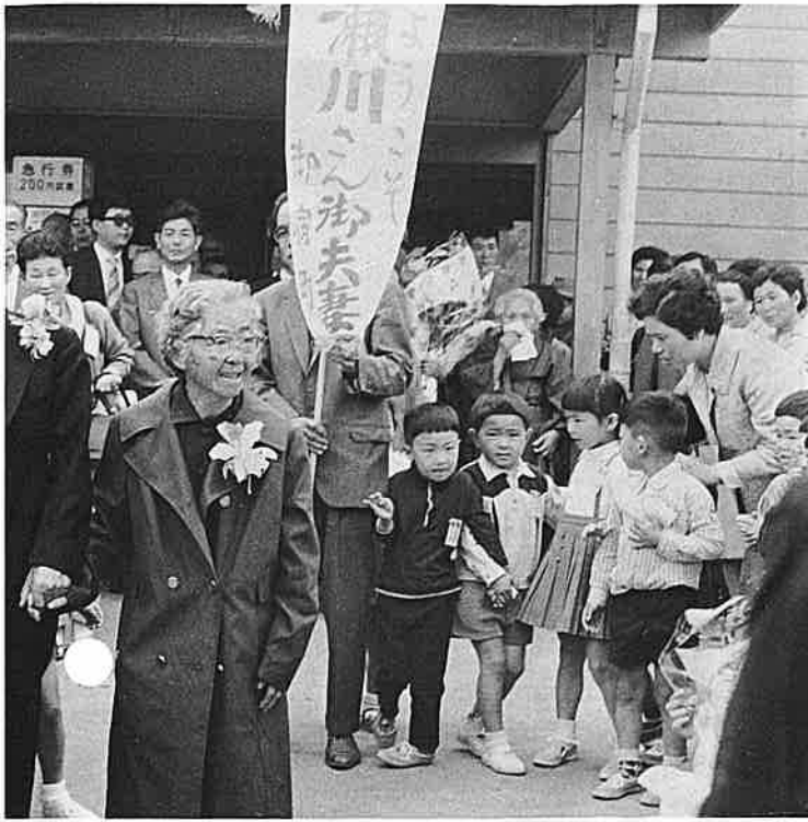
④ 観光関係者による進水式前のお祈り