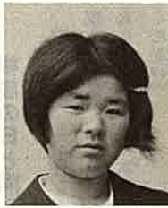
白鳥 絹枝 (浜)