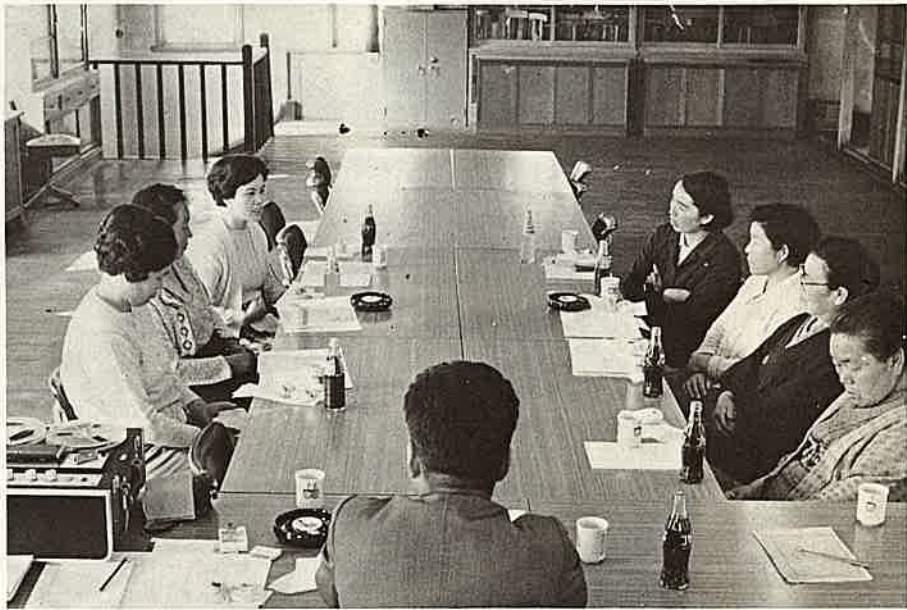
物価、生活改善など大いに語るモニターの奥さん方

よく手まめ、口まめ、足まめなどといいますが、これは買物じょうずな奥さんにつけられることばですね。つまり、品物を手でよくたしかめ、いろいろとようすを聞いて、足をまめに運んでいい物を安く買うという消費生活の上でかかせないテクニックです。ところで近ごろは、高度経済成長がさげばれ大型消費景気が庶民生活に浸透してはいるものの、なにかことばの暗示にかけられてはいないだろうか。わたしたちは、家庭と経済についてもういつべん身の回りを考えてみる必要があると思います。身近な生活の悪習や慣例にむだはないか、また物価の面に不合理はないだろうか。さらに町政に対しても納税者であり、消費生活モニターとして、奥さんたちにおおいにシ