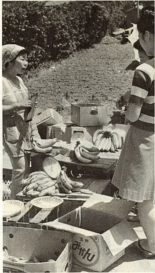
果物、野菜など安く売る露店