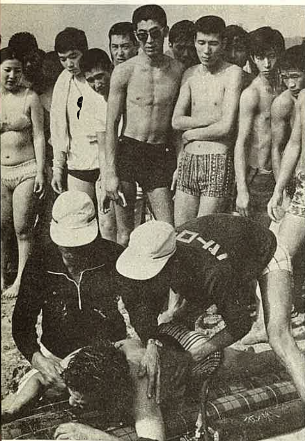
◁ 無ぼうな遊泳者がいるとパト ール隊はフル回転