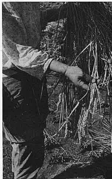
ウンカの発生でモミはみためにはわからないがからが多い