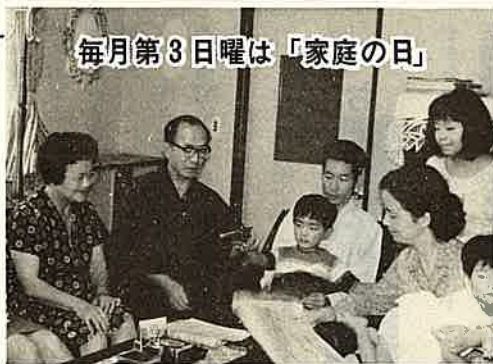
毎月第3日曜は「家庭の日」

町民が子ども会の順調な発展を暖かく見守るような気運の醸成に努めてほしい。 一、プールを造ってほしい。各学校と海岸にひとつづつといてもすぐには無理と思うから、適当な所に一つ、早急におねがいしたい。プールのある山間部の学校より、プールのない海岸の学校の方が泳げる子どもが少ないという、一見意外な調査報告がある。水泳は、だれでも知っている方がよいし、スポーツとしても、非常にすぐれたものであると思う。 (久保 岡村甲純)