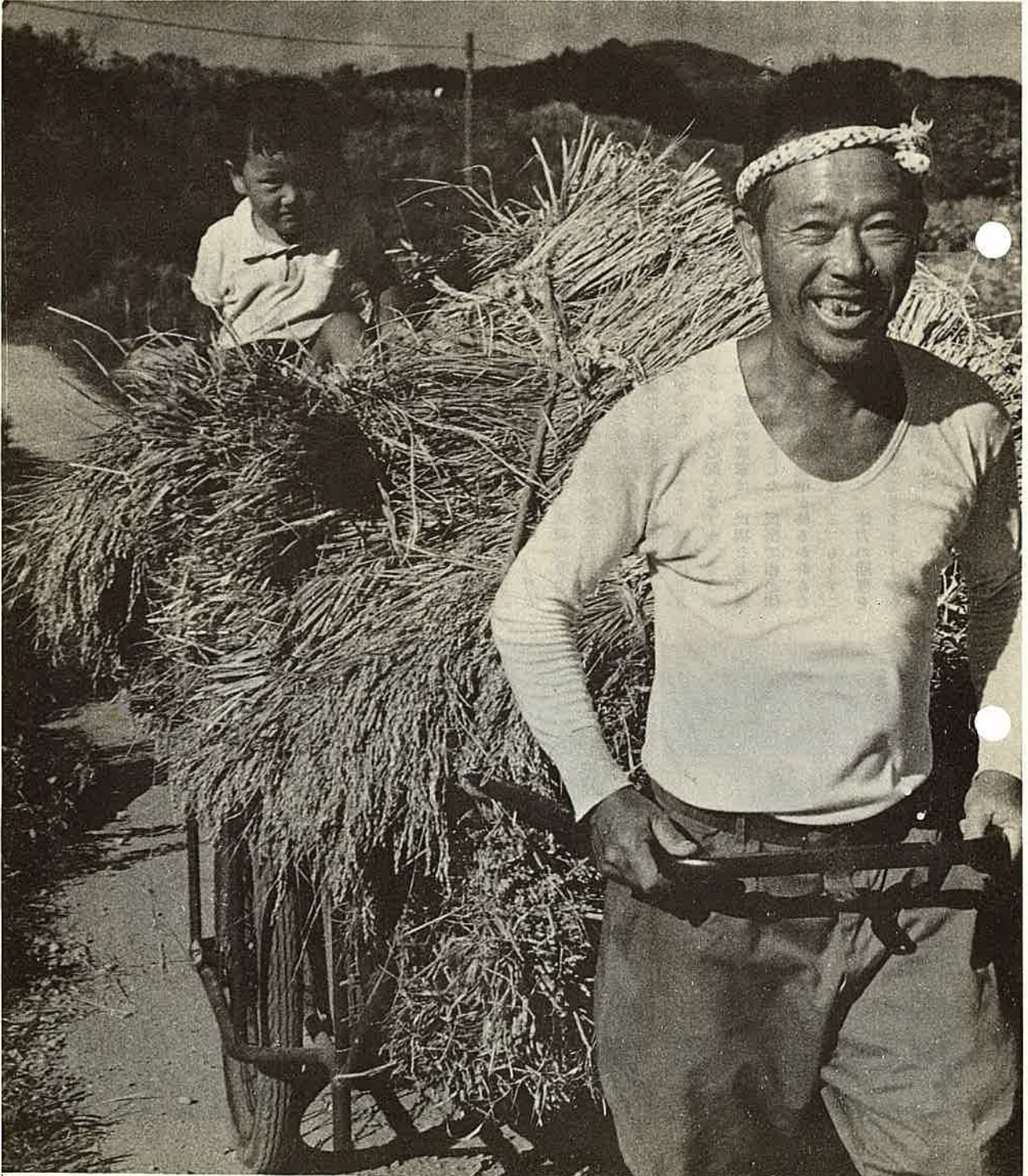
ことは 稲が不作だった それでも真心こめてつくった稲をはこぶ時は笑いがこぼれる