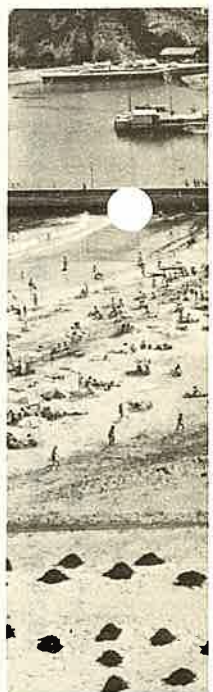
合人、人、人……このきれいな 海に一日十万をこえるひとがでる