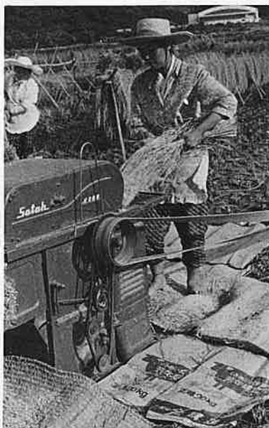
脱穀の手ごたえも軽しい汗の結晶は意外に少ない