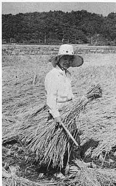
若い労働力が年々へっている娘さんの働らく姿はめずらしい