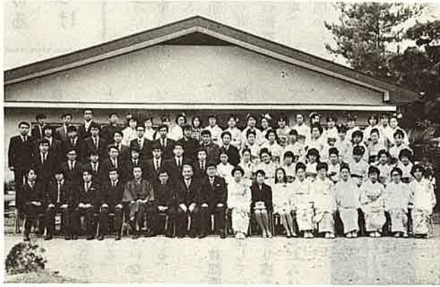
お揃いで記念撮影