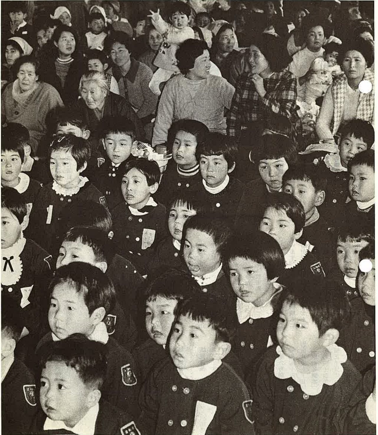
興味あるものをみる時のこどもの視線はすどく真剣だ。—保育園の生活発表会にて—