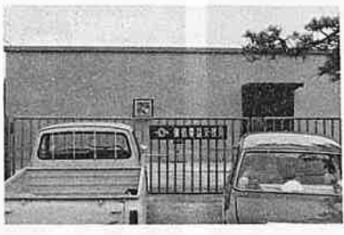
来春から動きだす交換局

(ニ)使用回数制限内で繰返し使用 する場合の使用間隔は七日以上。 (ホ)日本梨、桃、なつみかん、ほ うれんそう、ばれいしよには使用 しない。