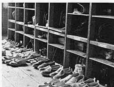
▲じぶんのものはきちんと