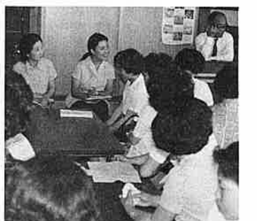
▲お母さんとの意見交換