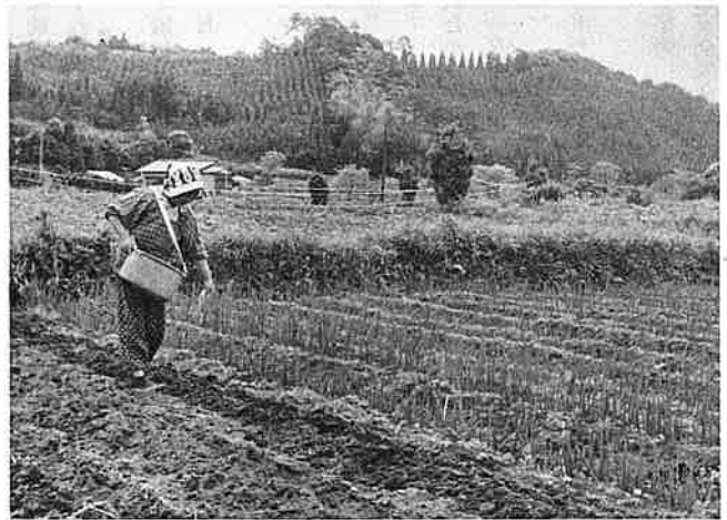
野菜づくりに精出す婦人会員

つぎに新しい試みをしたということ。この教訓が刺激となつて物価や生活改善ができることを