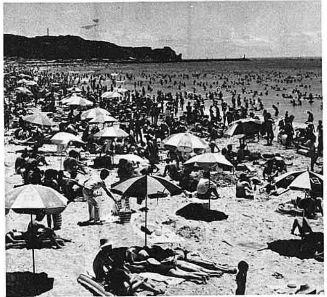
100万人をこえる海水浴客でにぎわった海岸

余暇や消費の拡大による観光旅行は、今後ますます増加する見通しです。経済の発展にともない、生産性の向上、省力化が進み、労働時間の短縮に結びつくものと思われまふ。週五日制の採用は常識となり、余暇の活用が増大が観光産業本命説の根拠となっています。