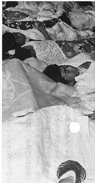
▲べんきょうがすんだら おひるね

間的な教育、親子の心のふれあいに時間的に質的に重さをおかなくてはいけないと思われまます。そのためにも、会員同志建設的な集まりを多く持ちたいものです。