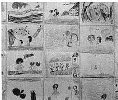
▲じょうずなぼくらのえ