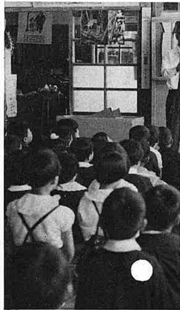
▲えんちょうさんの あさのおはな

乳幼児から少年、そして青年へと成長していくにつけても、幼児期の基礎的な人間形成につながる保育は、環境を整備することも大