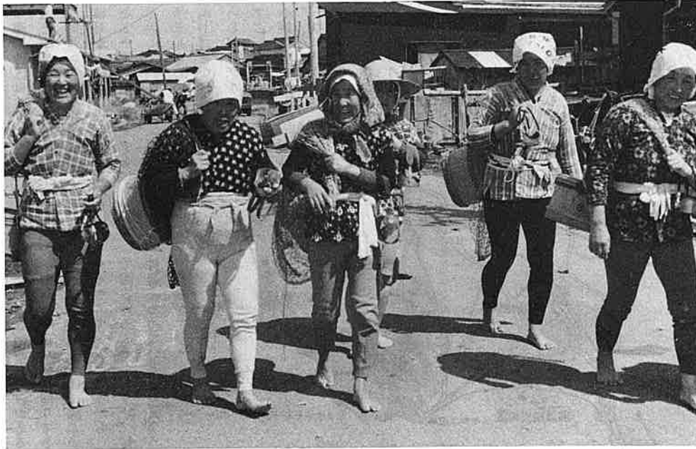
きょうの収穫はと胸算用に顔もほころぶ