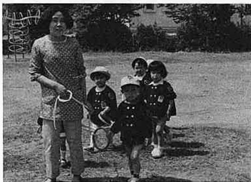
▲朝の散歩 三歳未満児はいつも行動がいっしょ