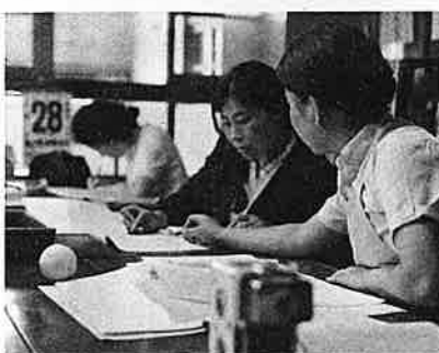
▲子どもたちを帰したあとは あすの準備