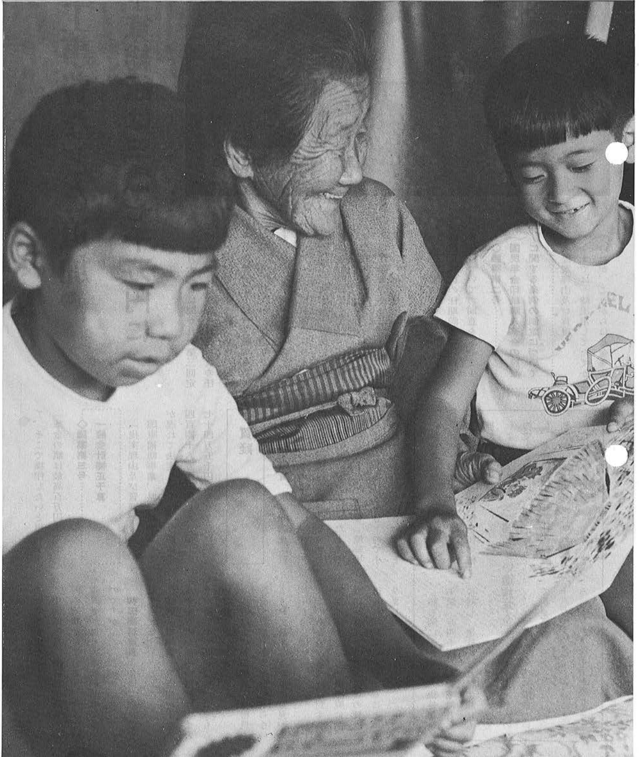
読書の秋——おばあちゃんに本を読んでやるよい子