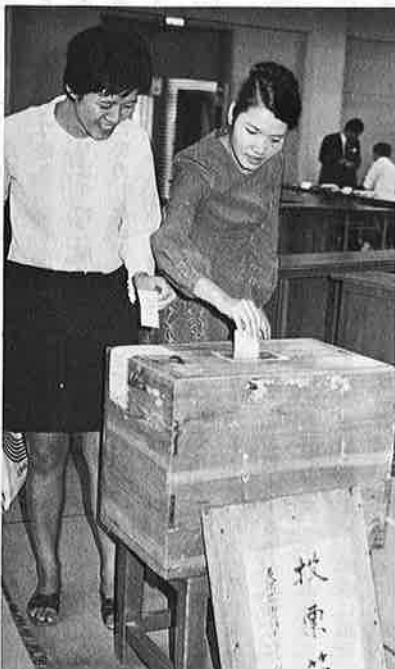
若い人も買い物帰りに清き一票