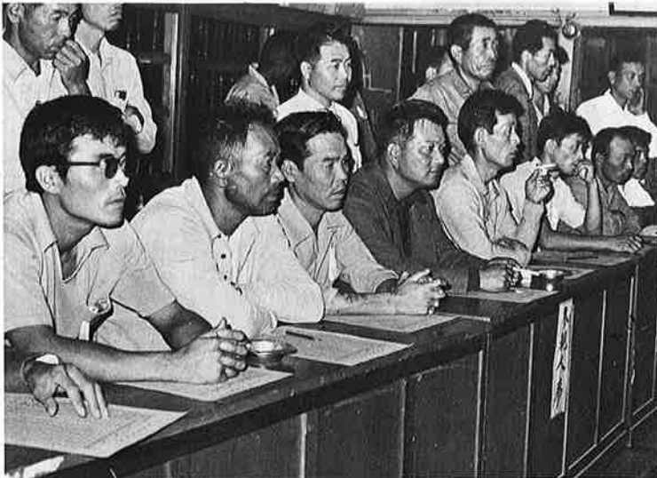
期待と不安の表情で開票を見守る参観人

営管理のあり方も参考にして、その行政運営について内部管理をも含む徹底的な合理化、近代化を推進させなければならない心然性に迫られています。そしてこの問題にどう対応するかが当面する課題のひとつだと思います。いまこそ温かい血の通った政治力の必要性を痛感している次第であります。