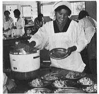
栄養改善推進員のなごやかな調理光景

日常の食事の栄養を改善し、健康な家庭づくりをし、地域の住民の食生活の向上をおし進めようという主婦たちが「御宿町栄養改善推進員」に委嘱されました。