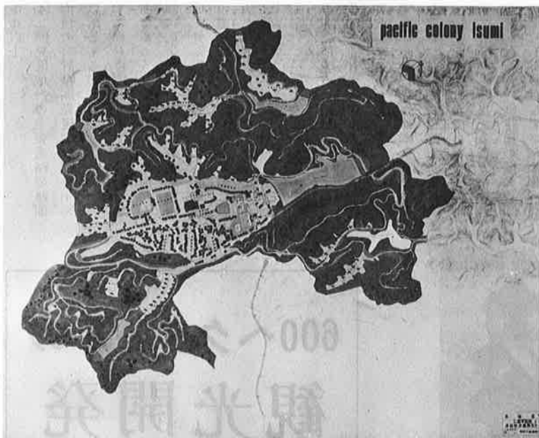
写真⑤ 保養団地の造成は自然保護に細かい配慮がしてある

開発庁は、この事業を進めるにあたって、県庁の関係部局長、御宿町と大原町の代表者各三名を含む十五名で構成する開発協議会を