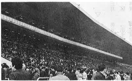
世をあげてギャンブル。その中でも最も人気のあるのが競馬