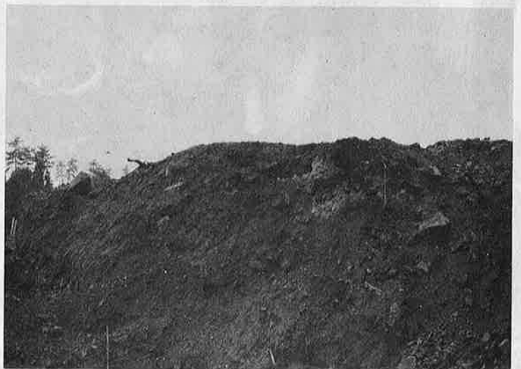
写真②緑をけずり宅地造成が進められていく山林