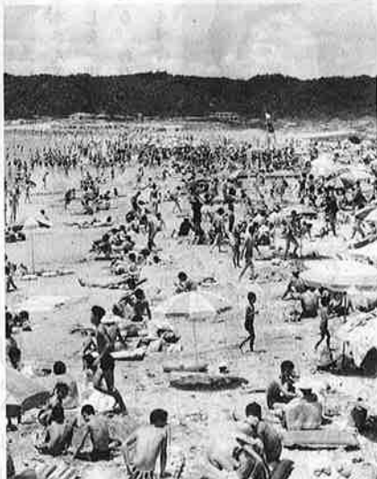
写真②—夏百万の観光客をむかえる海水浴場