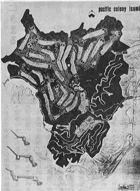
ゴルフ場を中心としたレジャー施設がつけられる