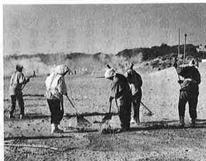
写真③おおぜいのお客さんに喜んでもらうために海岸はいつもきれいにしておく