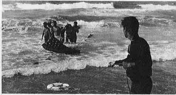
写真①パトロールの注意をきかず無謀遊泳者はあとをたない。海を甘くみると危険だ

客に対する（とくに遊泳者）監視体制を強化します。また、観光行事をあげ、観光のポイントを夏季以外にもひろげる、そのためにはオフシーズンの宣伝に力を入れます。