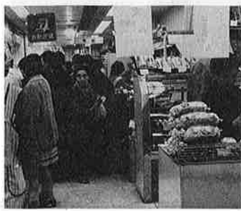
高級品よりも実用品が人気を中心。

消費者はよいものを安く供給してほしいという。夏季の需給のアンバランスによる値段の高騰もある程度はがまんできますが、異常なほど値のはるがあります。一方、国、県では流通機構の整理統合など必要とか需要の抑制とか行政指導にのりだしているが、旺盛な需要をおさえることはほぼ不可能。現時点では物価を下げる決める手は見当たらないのが実情です。