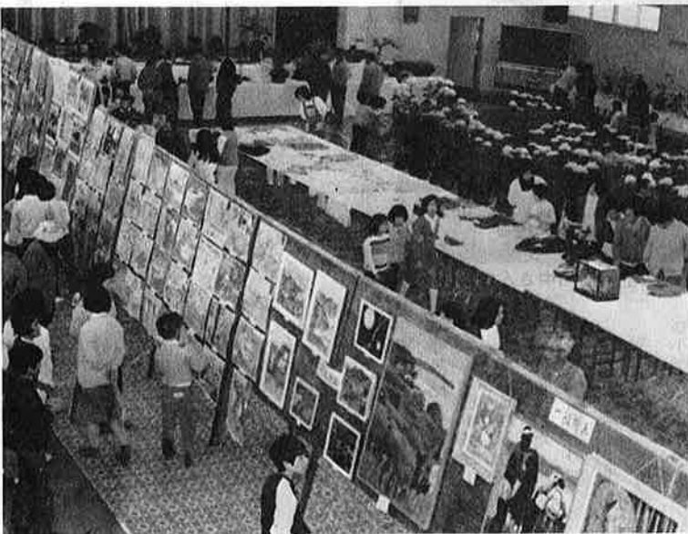
雨の文化祭 例年より人出の少なかった会場

気品のよい作品にはおおぜいの人が見物しました。一方、三日に行なわれる予定の体育祭は、雨のため中止されました。これで体育祭は二年連続雨に見舞われたこととなります。