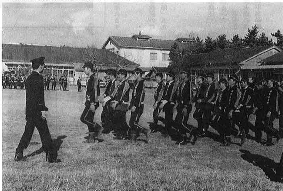
火災シーズンを迎え みっちり訓練する団員