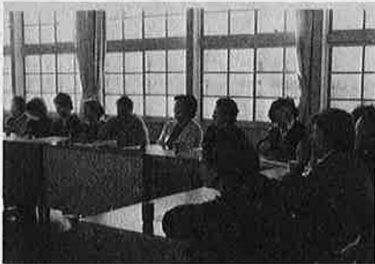
写真 物価は主婦にとって最大の関心事、身近で切な話題が多い

観光が年々盛んになってきましたが、八千五百人の町民が観光に依存しているわけではありません。このため、観光による弊害もある