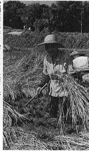
定期健康診断を受けいつも健康な体で

農業にたずさわる婦人の健康管理をとりあげ、去る四十五年から毎年健康集団検診、健康調査をつづけてきました。