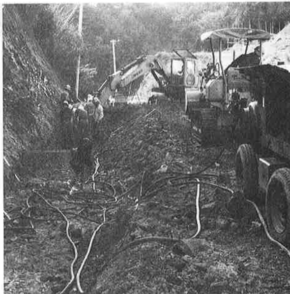
環境整備 とりわけ道路の改良は住民から最も要望の多いものの一つです