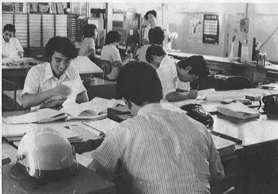
写真＝職員給など人件費の比重が高まるとともに職員の事務量、責任、サービス精神も高まらなければならない