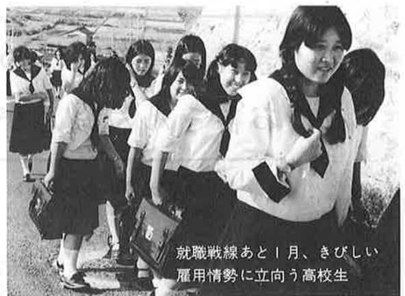
就職戦線あと1月、きびしい雇用情勢に立向う高校生

者。この数は例年に比べかなり少なくなっている。つまり年々進学者が増えているという。ことしは経済情勢が不安定なことによって求人が昨年の半減ということからもこの傾向はうなずけよう。 これに対して生徒の就職希望をみると、公務員や金融機関などが比較的多く、安定した業種に人気