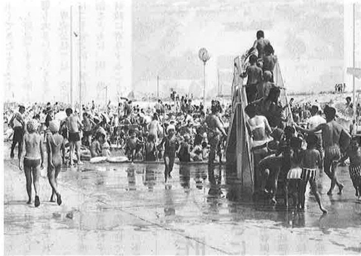
昨年を下回ったプール入場者

これは天候がよく、しかも海岸の状況がよかったため（遊泳可能な日が多かった）にプールの利用がへったこと。