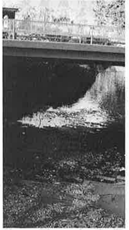
清水川の清流が濁り、排水が流れてくると、水質が悪化する。

夏の日照り続きで清水川の水が 大変少なくなつてしまつた。夏に は大量の小魚が酸欠か農薬か原因 不明のまま浮きあがつた。 台所の雑排水や浄化槽の処理水