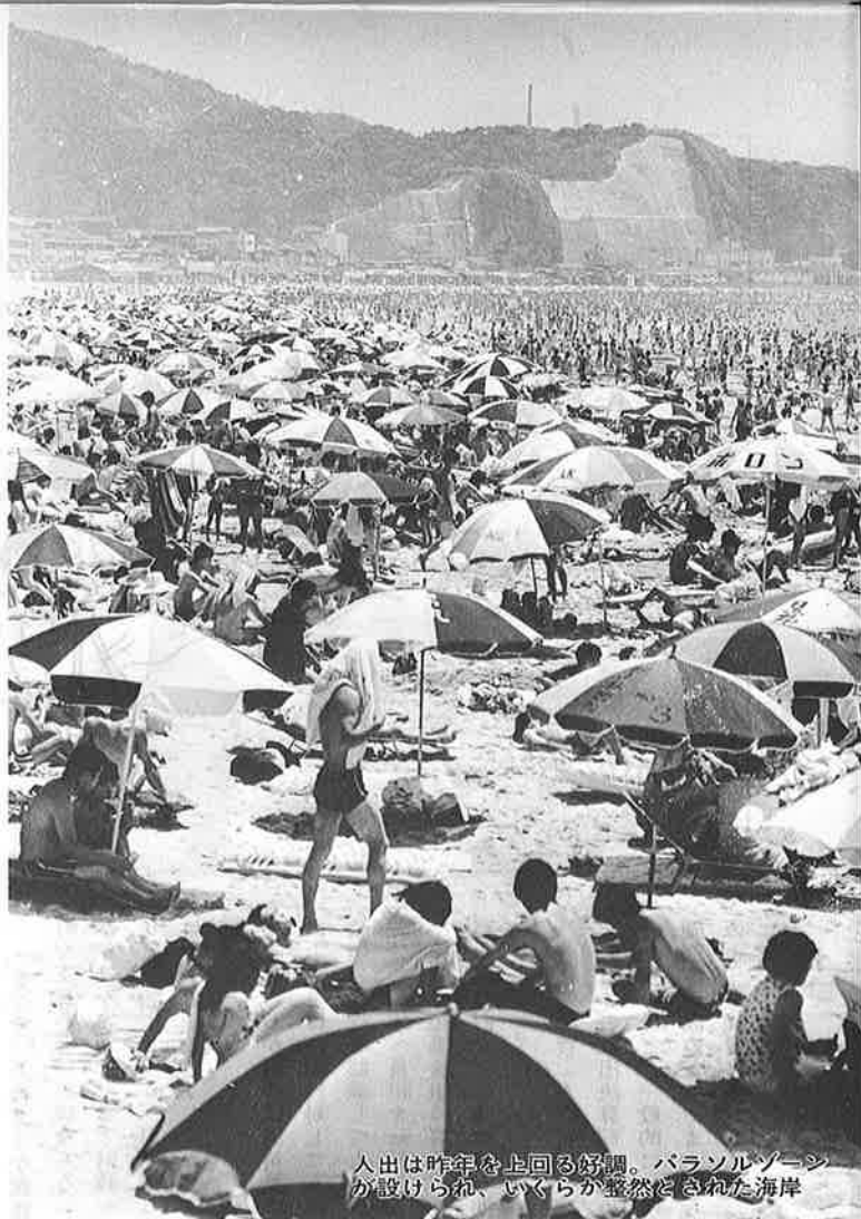
人出は昨年を上回る好調。パラソルゾーンが設けられ、いくらが整然と並べられた海岸