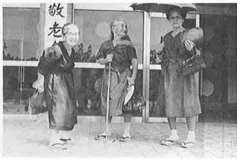
すっかり満足した面持ちで会場をのぞくお年よりのたち

四世帯あります。これらの人たちは、九十歳以上の高齢者など、ともに知事や町からの祝いをうけ、記念品を贈られました。ご夫婦お揃いで式に参加したカップルがなく残念でした。 ことしの敬老会は、芸技組合のご好意により舞踊が披露され、おとしよりを慰めました。