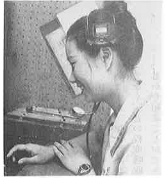
同居老人電話で朝の話し合いが行われる 交換嬢の呼びかけに生がいを感ずる