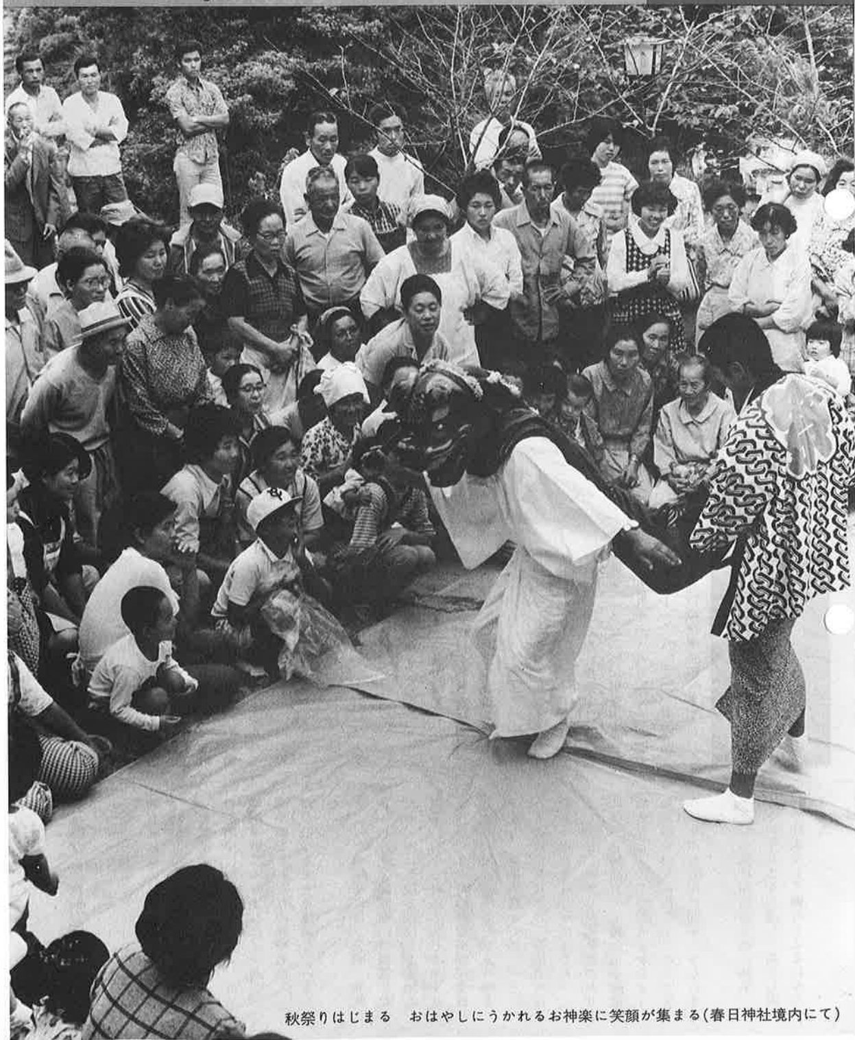
秋祭りはじまる おはやしにうかれるお神楽に笑顔が集まる(春日神社境内にて)