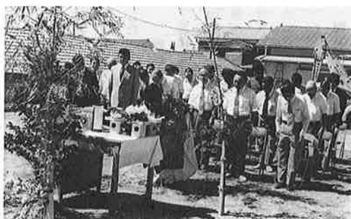
岩和田保育所の早期完成を 祈念し 地鎮祭が行われた