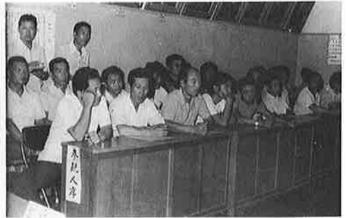
参観人のするどい目が票を追うように 緊張と興奮の時が流れる