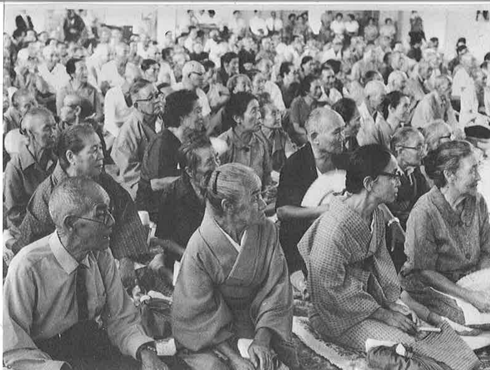
敬老会はじまって以来の多数のおとしよりが参加し 熱心に舞台に見入る

ことしの敬老会に町から招待を受けた、おとしよりは、七百三十八名(町民全体の約九・三%)。町民百人のうち約十名の人が長寿のお祝いをうけるために参加できる数です。