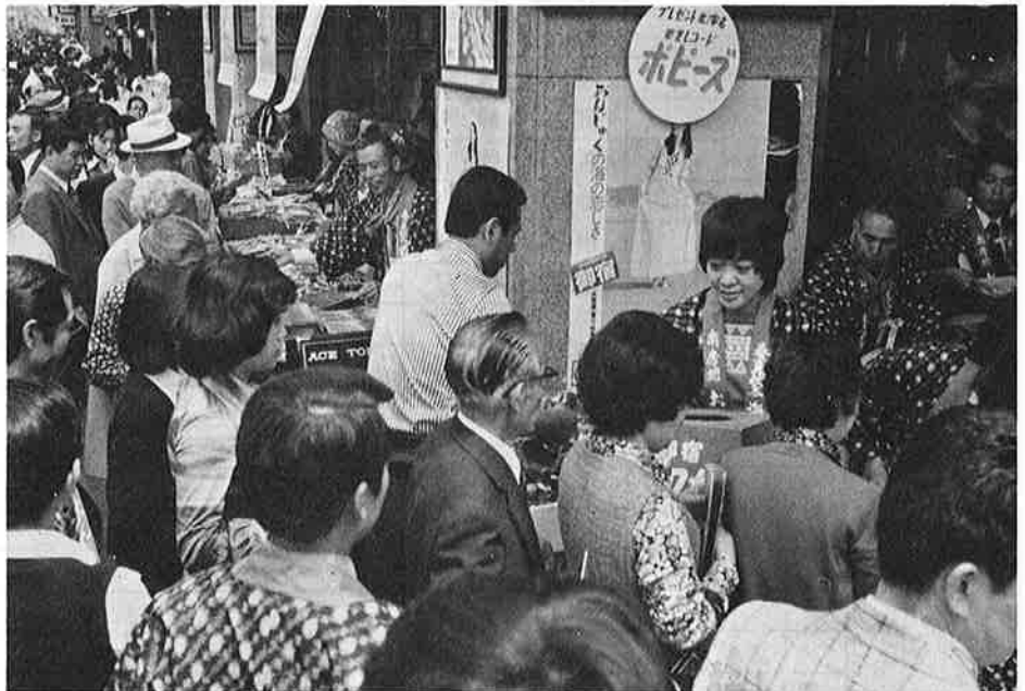
東京・銀座の三越で開かれた観光宣伝