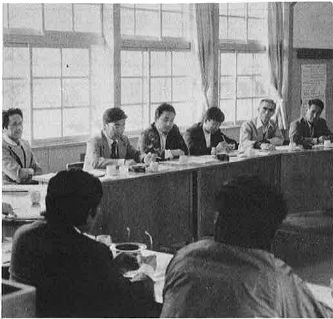
今年の観光計画を決めた理事会

本格的な夏の観光シーズンを前に四月二十一日、観光協会理事会が開催され、今年度事業計画が次のようにきめられました。