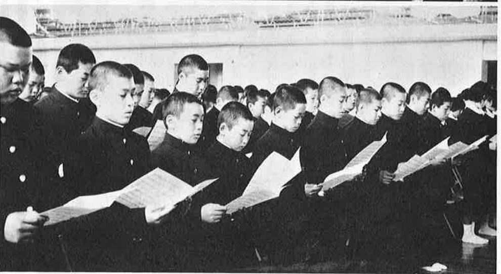
①御宿小入学式②岩和田保育所入園式③御宿中入学式