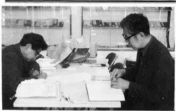
整理が進む五倫文庫