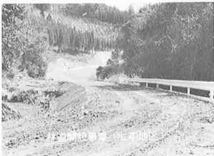
高山田地区の水田利用再編