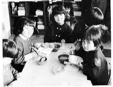
次代を担う子らのために…