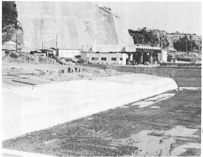
今年度で完工の岩和田漁港改修事業

万円。 岩和田漁港改修事業は、昭和四十八年度から実施してきましたが今年度で完成します。また、関連事業として、トンネルの改良、巻立、道路の整備など実施します。