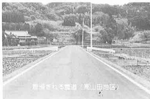
整備される農道（高山田地区）

道整備、久保地区農道舗装、小幡地区農道舗装、館山地区農道舗装、本郷線林道開設事業費などです。