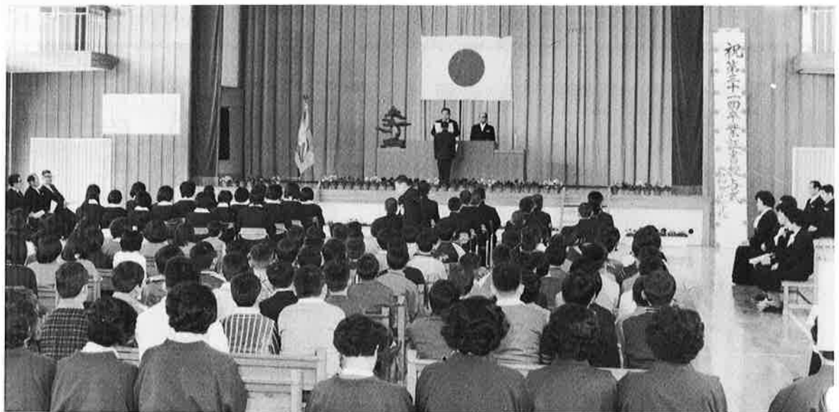
♠ 岩和田小学校 (新築の体育館で)