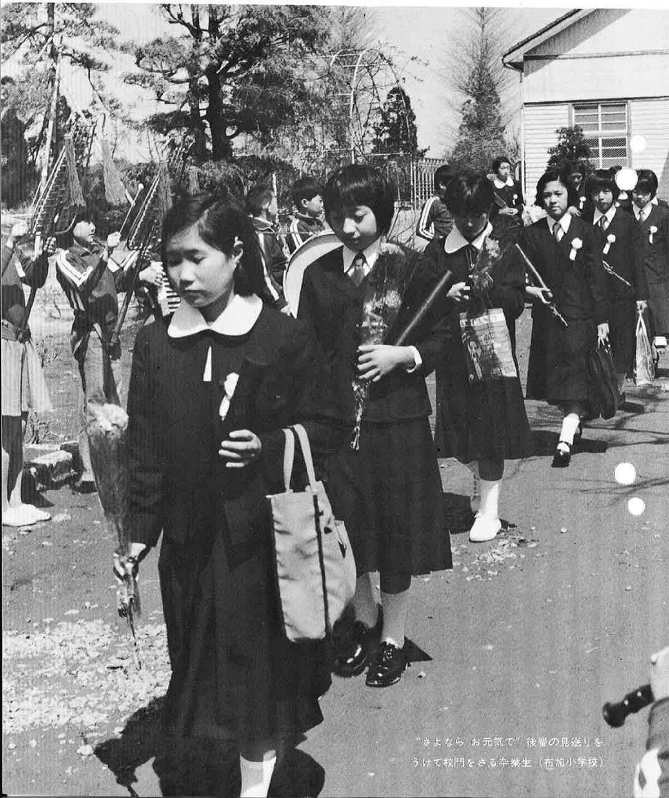
“さよなら お元気で” 後輩の見送りを うけて校門をさる卒業生（布施小学校）