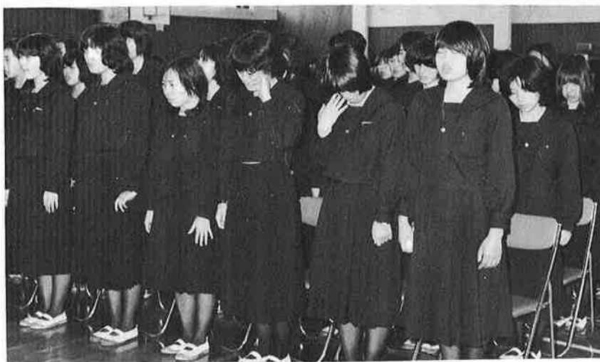
◀ 御宿家政高等学校