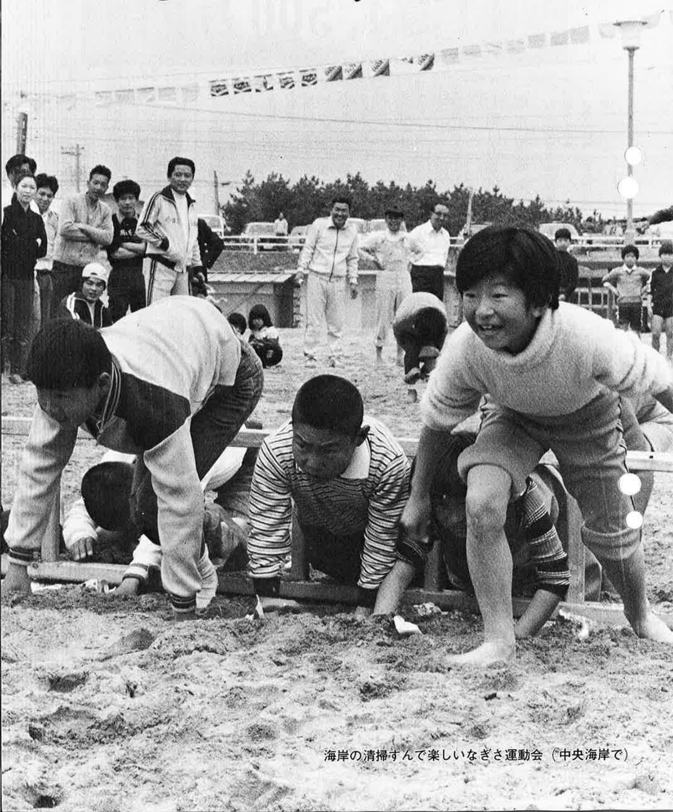
海岸の清掃すんで楽しいなぎさ運動会（中央海岸で）