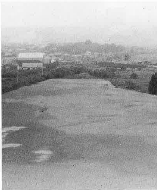
工事中の町営グラウンド