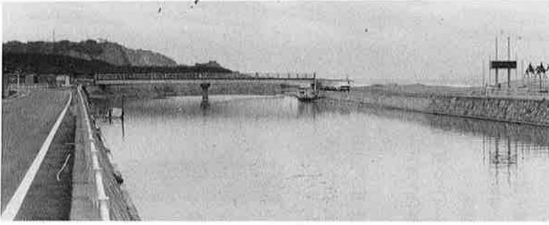
盛大に完工式をあげた砂丘橋

当日は千人ちかい人でにぎわい、もちなげやおシルコサービなど集まった人達も大喜び。