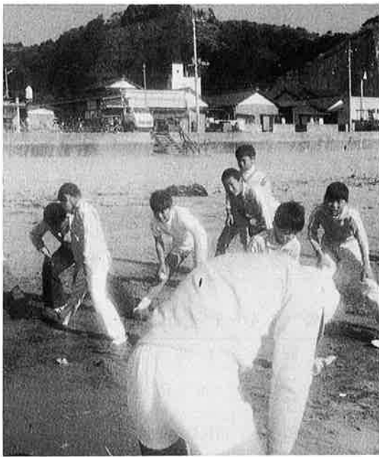
熱心に練習する子どもたち。

ぱりうまくは行かなかった。ゴールの横や上の方にそれてしまうのです。なかなかうまくボールが、ゴールポストに入りません。でも、スヤドリブルができるようになって