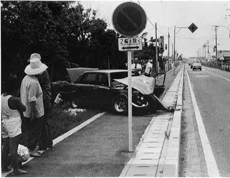
こんな事故は絶対になくしましょう

—としての基本的事柄をきちんと実践してこそ、「事故のない明るい社会」への第一歩といえるでしょう。