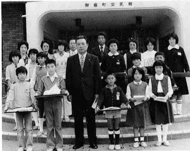
町長を囲んだ大会参加者

小さな親切、小さな親切と口では言うが全く実行していない。私はこのことを強く恥じてやみません。