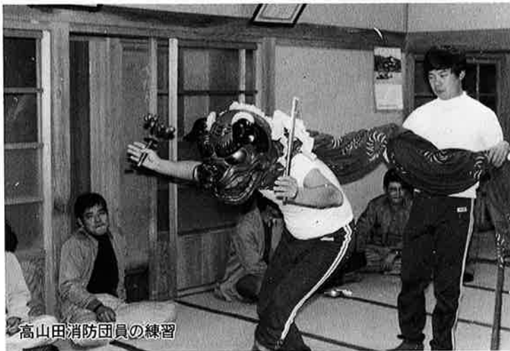
高山田消防団員の練習

若くは、とかく「老後なんてまだまだ先の話」と思いがちですが、将来受け取る年金は加入が早いほど有利です。ただし、厚生年金などの公的年金に加入している人は加入する必要ありませんが、他制度の配偶者や、昼間部の大学生のみなさんは、希望することにより加入することができます。国民年金に加入して、老後の暮らしを、より豊かなものにしたいものです。保険料は、月々三千三百円です。