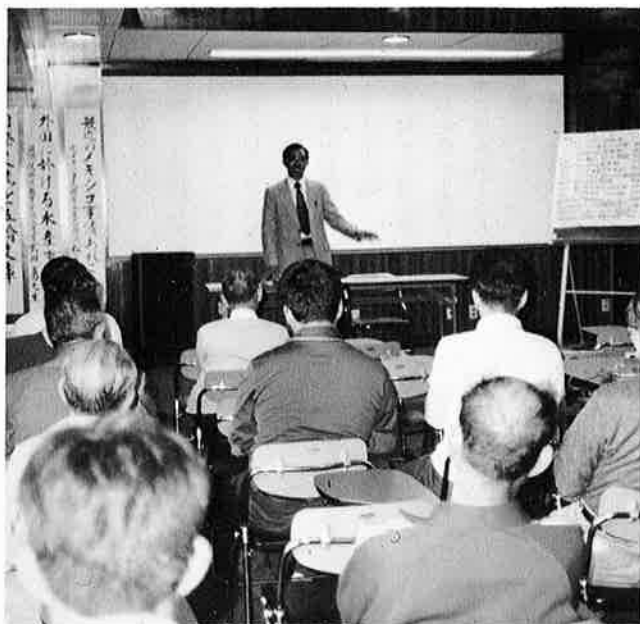
「最近のメキシコ事情を語る」講演会から

十月十四日メキシコを理解するために「メキシコ事情を語る講演会」が公民館で開催され、参加者は少なかつたものの、とても有意義な講演会でした。