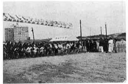
なぎさマラソン大会から