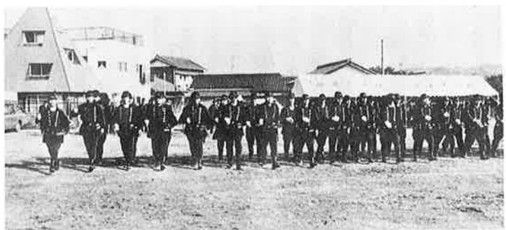
第10分団による小隊教練