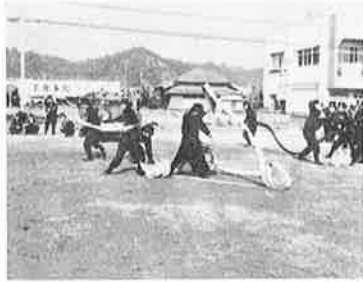
第8・10分団による小型ポンプ操法