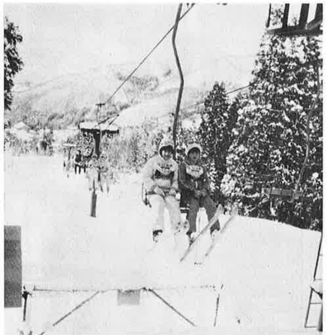
リフトからのアルプスのすばらしい遠望