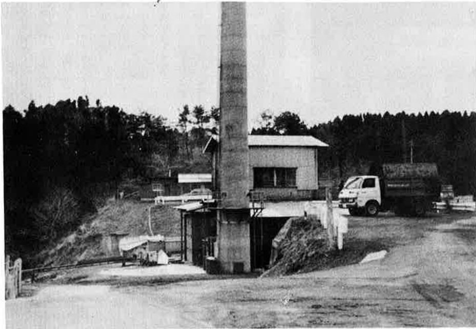
きれいに整備されている焼却場

集日を分けたのは、一緒に処理を すると収集職員がとでも危険だか らです。今までも作業中にケガを したり、危険な場面がありました。 特にスプレー等は、熱により中の 空気が膨張し、思いもよらない破