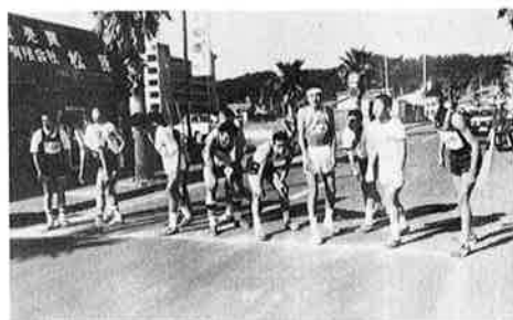
郡一周駅伝大会が二月十一日、御宿町役場前から大多喜小前までの三十二・九キロのコースで行われました。この大会は今年で七年