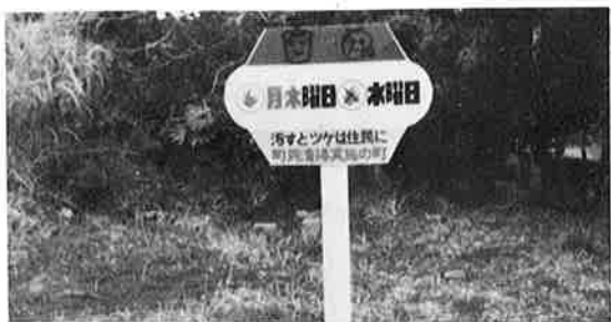
今年度設置された須賀集積所看板

その結果をアンケート調査によって把握し、対応を方向づけたいと思っています。モデル地区になった区のみさんのご協力をお願いしたいと思います。