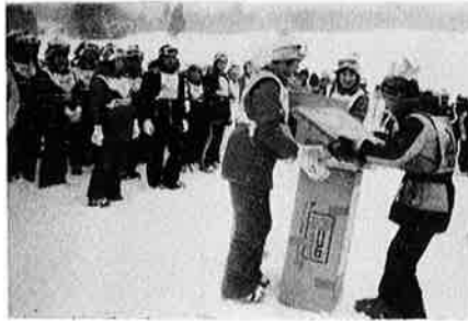
交流会でプレゼントの交換

午前七時三十分「さあ！」待ちに待ったスキーだ。去年の夏野沢の皆さんからプレゼントされたスキー靴は知っているが実際に雪の上を歩くのは始めての生徒ばかり