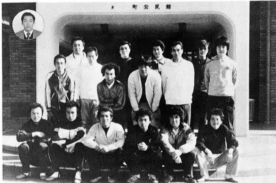
健闘した御宿町チーム