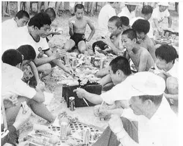
▼ お母さんたちの手づくりバーベキューで満腹