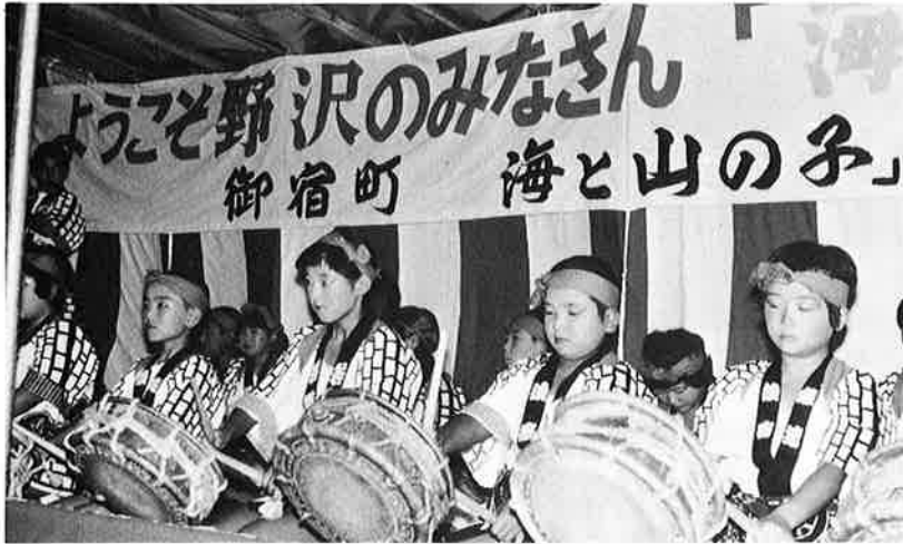
▲夜空にひびく歓迎の太鼓(岩和田子供ばやし)

七月二十八日から三十日までの三日間、野沢温泉村中学校生徒、関係者百名を迎え、海と山の子交流会が開かれました。台風の影響で天気にはた。