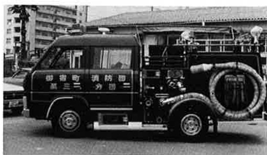
▲ 配備されたポンプ車

今年度の重点施策の一つであります防災対策の一環として、第三分団（六軒町）に新しいポンプ車が、配備されました。七月十一日、役場前で引渡式が行なわれたあと、分団員は、機械の説明を受け、さっそく試運転を行ないました。