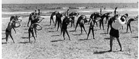
泳ぐ前にストレッチング体操