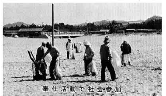
参加社会で活動奉仕

高齢化社会に備え、歳だからという先入感を捨て、長寿を願う半面、自分自身で能力の低下を防ぐ方法に傾注し、その努力を考へることが、老後の幸せを求めるといふところではないでしょうか。 (御宿町社会福祉協議会事務局 長)