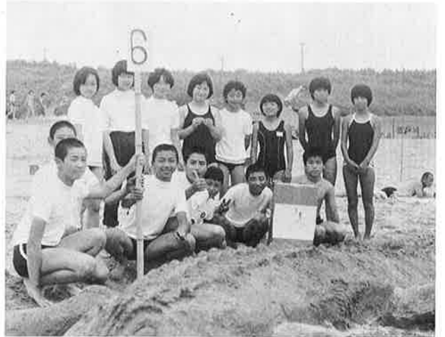
▲ 野沢中・御宿中合作の芸術、見事1等賞