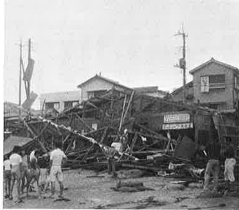
波と突風で倒れた海岸売店