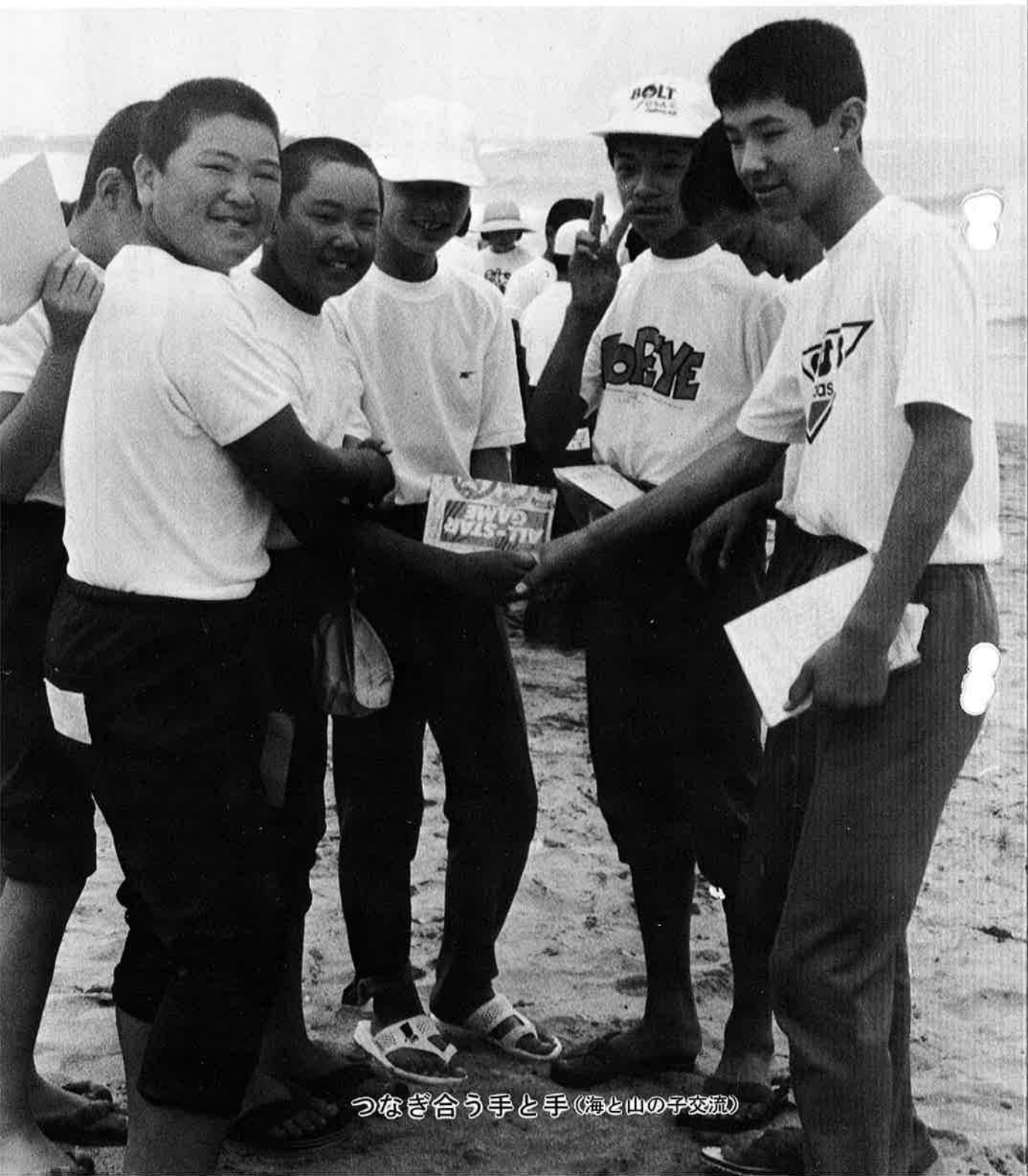
つなぎ合う手と手 (海と山の子交流)