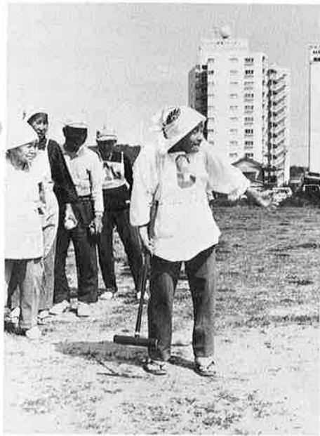
▲楽しみながら健康に

特技、趣味などを生かし、住民のためになるような奉仕活動を行なうことや、若い人たちの気持ちを理解して相談相手になってやる事や、自分自身で健康に留意するように努めることが大