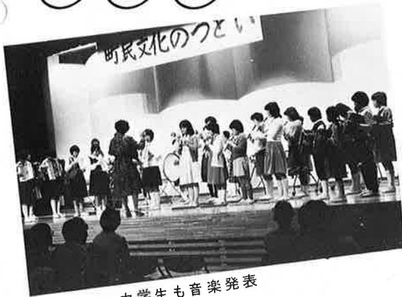
▲小・中学生も音楽発表

恒例となり年を重ねて定着化してきた町文化祭、今年も去る十一月三日、四日と二日間開催し盛会の裡に終りひと先ずホッとしていると先ずホッとされているところでありませう。 よく「文化祭はどんな意味があるだろう？」と「どんなメリットがあるのか？」と反問されることがありますが、むしろかしい理くつは抜きにして、町の中には個人で、またグループ、団体でコツコツと特技、趣味に応じて余暇を楽しみ、教養を高め、生き甲斐を感じている人たちがたくさんいるわけです。みんな文化活動をしている人たちだと思