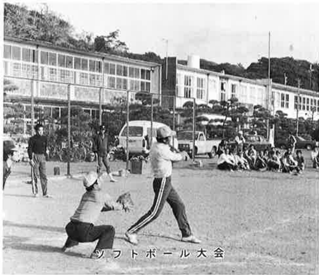
サッカーボール大会