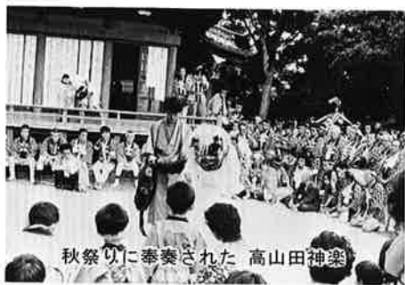
秋祭りに奉奏された高山田神楽

四百年の歴史をもつといわれ ている高山田の神楽が、町の無 形文化財に指定されました。 文化財といいますが、古い神 社や寺院の建物、彫刻や絵画と いった形のあるものと考えられ がちですが、建造物や美術品ば かりでなく、人から人へ伝えら れてきた伝統的な芸術や技術、 日常的な習慣といった形のない ものなども文化財に含まれます。