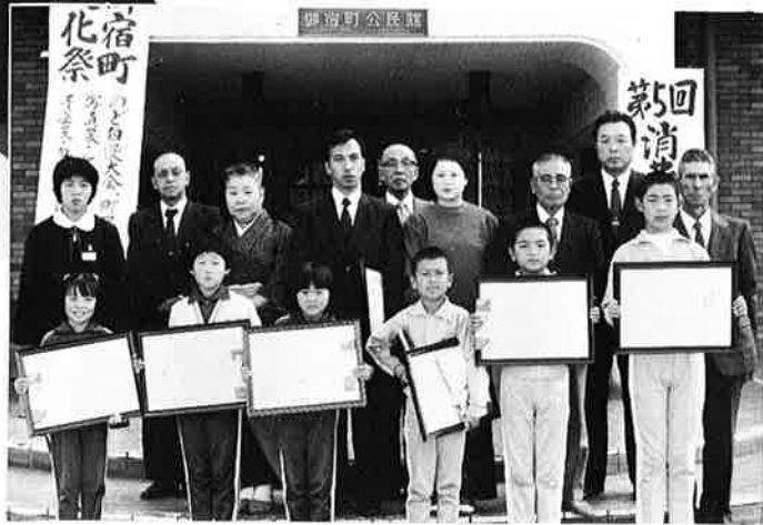
▲高梨町長から表彰状が贈られました