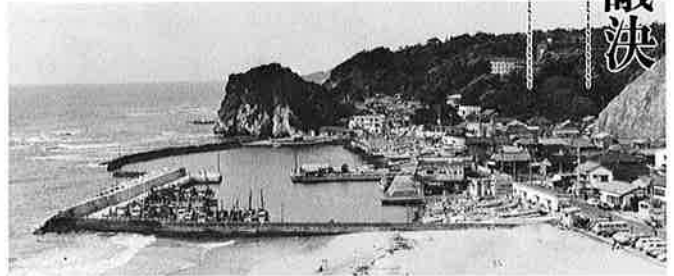
▲今年度5千4百万円の工事費で改修される御宿漁港