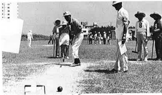
▲幅22センチのゲートをねらう

町では数年前から、お年寄りの仲間づくりを進めるため、ゲートボールの普及に力を入れ、