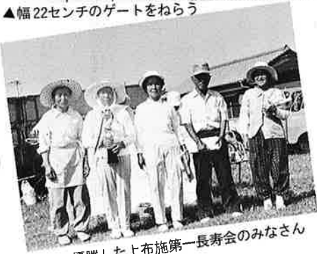
▲優勝した上布施第一長寿会のみなさん

りは元氣一杯。二十二センチ幅のゲートをねらって、力強くボールをたく姿は、まさに「健康万歳」。