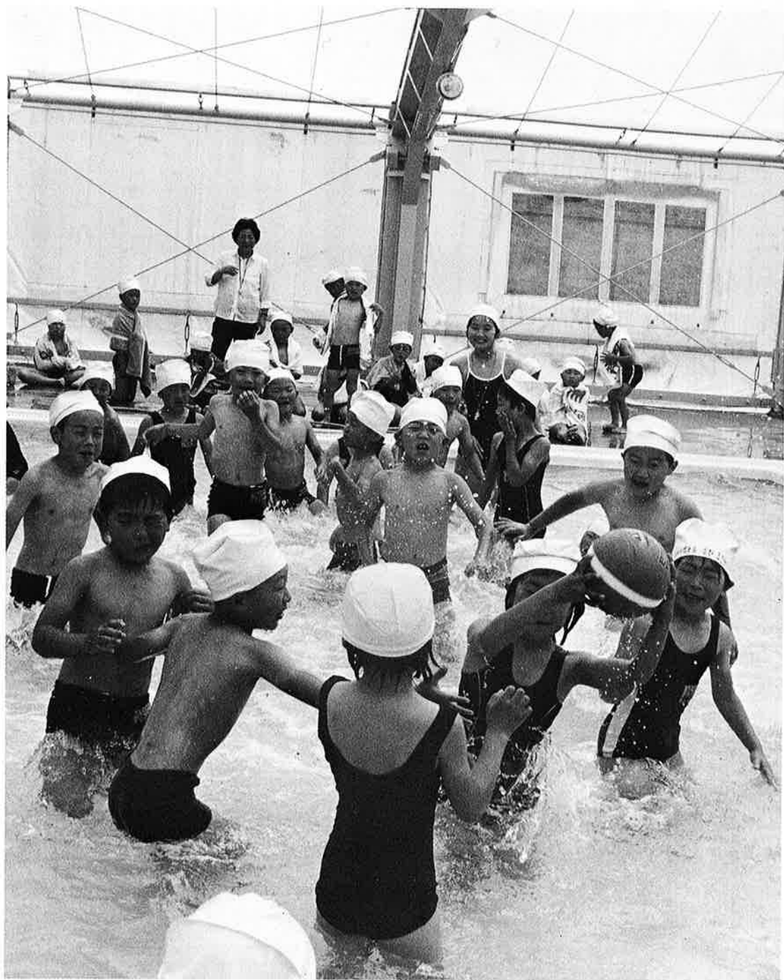
水に親しむ（海洋センタープール）