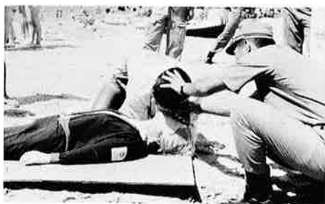
▲消防署員による応急手当の指導(中央海岸)

これを機会に、「自分のことは 自分で守る」という自主防災の 見地から、「わが家の防災対策」 について、家族みんなで話し合 うことも大切です。