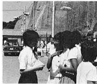
▲野沢での再会を約束