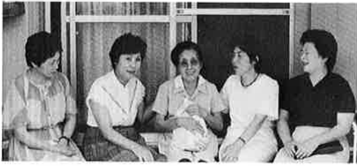
▲明るく元気なおばあちゃんと談笑する日赤奉仕団のみなさん