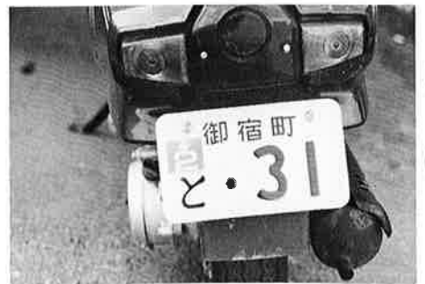
▶ いますぐ確認 自賠責保険期限

期限切れをチェックする方法がないので、つい忘れてしまいがちです。 小さなバイクだからといって事故が小さいとは限りません。人身事故もたくさん起こっています。いざというときのためにも、自賠責保険に加入しておきましょう。 詳しくは、自賠責保険については損害保険会社その代理店（バイク店、自転車店など）、自賠責共済については農業協同組合にお問い合わせください。