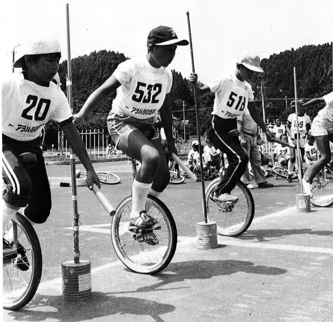
バランスとスピードを競う(夷隅郡市一輪車大会)