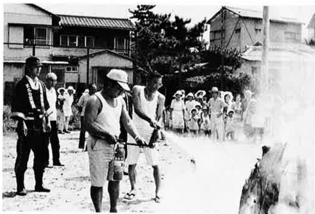
▲参加することが第一です(昨年の訓練・六軒町区)