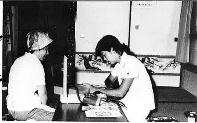
▲保健婦による健康づくりのアドバイス（健康相談）