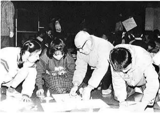
たこづくりを通して世代間の交流が広がる

那教育委員会の事業のひとつに、高齢者もつ伝統的な知識や豊富な経験、体験、技能を次代を担う子どもたちに伝えることにより、世代間の交流と地域の教育力を高めようとする「高齢者ふれあい学級」がある。 その内容は、花づくりや人形づくり、注連縄、竹細工などの作り方、また郷土の民話や歴史な