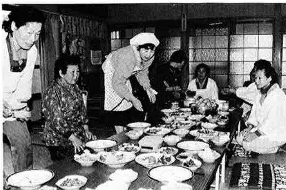
▲お米や野菜など自家生産物を使っての料理実習 (野沢菜生活改善会)

総理府の調査「食糧及び農業農村に関する世論調査」の中で「米は日本人の主食として最もふさわしい」と答えた人が九割を超し、前回（五十五年）前回（五十年）に比べて、国民の米に対する好感度が大幅に上昇していることがわかりました。同時に「米飯は肥満になる」などの悪い印象が減って、「米は栄養に富む」と考える人が増えており、ふだんの食生活でも米が主食の座をしつかりと確保し