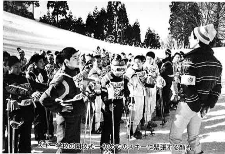
スキー学校の開校式—初めてのスキーに緊張する顔も