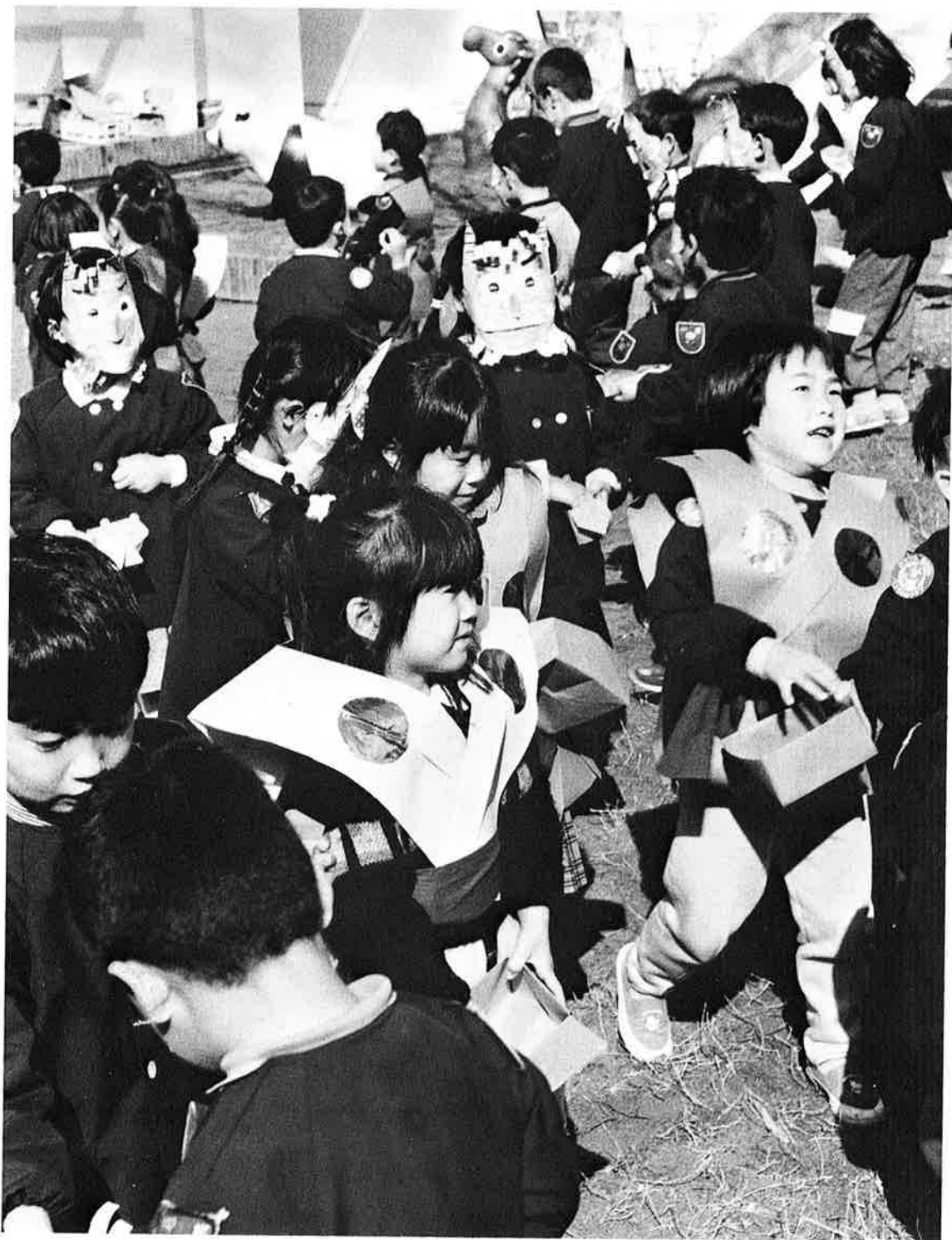
“鬼は外、福は内” 元気よく豆をまく子どもたち(御宿保育所)