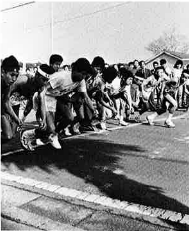
▲御宿町役場前を一斉にスタート

御宿町役場前をスタート、大多喜小学校までの三十二・九キロのコースで健脚を競い合いました。