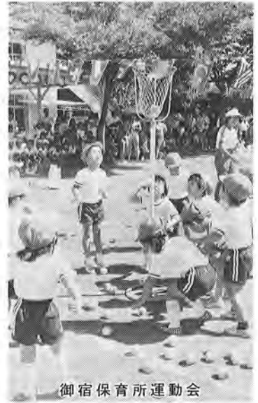
御宿 保育所運動会