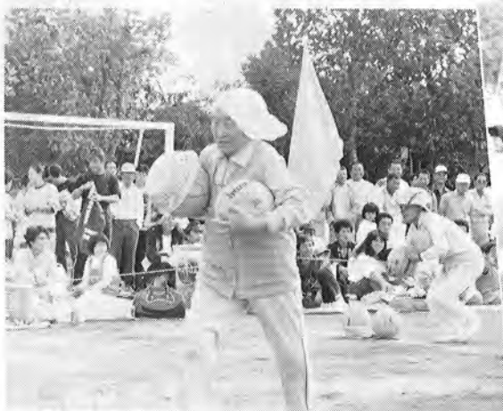
▲ お年寄りもハッスル