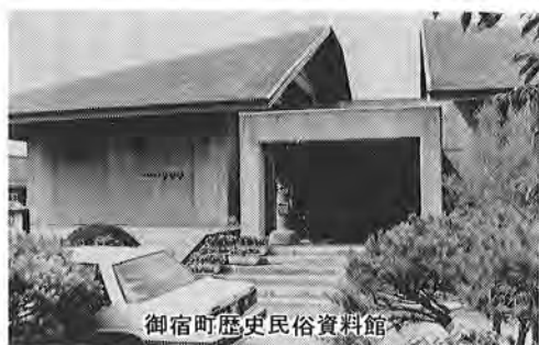
御宿町歴史民俗資料館