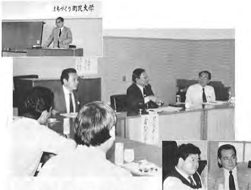
町民の意志を反映したまちづくりを進める目的で開設した「まちづくり町民大学」—第一回目から積極的な話し合いがもたれた。

住民参加のまちづくりを推進するため開設した「まちづくり町民大学」が、十月十二日、開講しました。住民と行政担当者が、共に学び、語り合い、よりよいまちづくりを進めようとするこの事業に二十代から四十代までの二十名が参加。 第一回のテーマである「マリン・リゾートのまちづくりを考える」について積極的な意見交換を行いました。そこで第一回「まちづくり町民大学」で行われた基調講演の内容と、座談会での主な意見を要約してご紹介します。