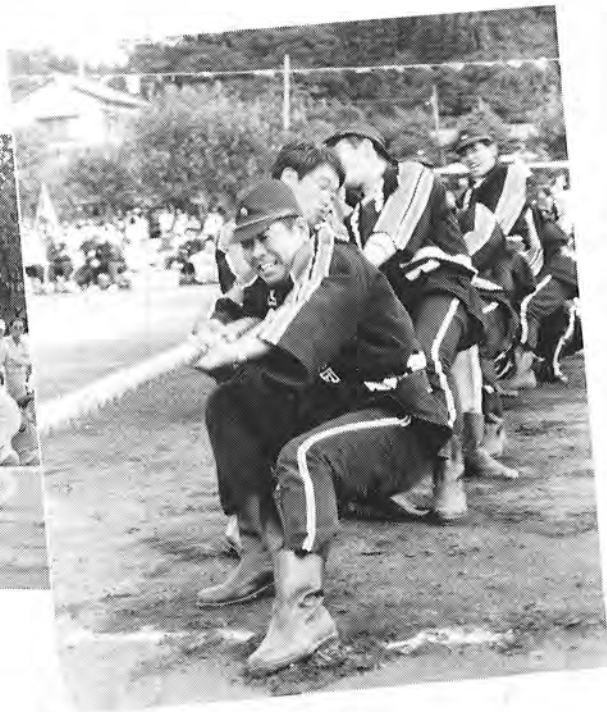
▲ 力が入る 消防団綱引き