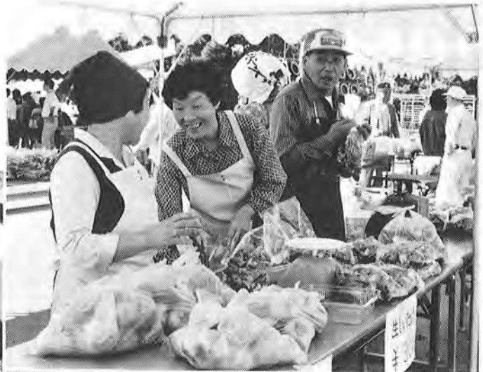
▲たくさんの人出に出店者の表情も明るい (農林業まつり)

り広げられました。 また、公民館では、 消費生活展が同時開催 され、賢い消費者とな るためのヒントやお米 の料理の試食会などが 行われました。