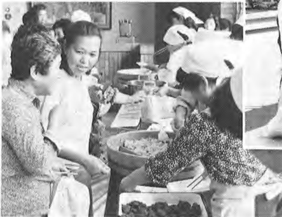
◀町栄養改善会の協力で行われた「米の料理」試食会 (消費生活展)