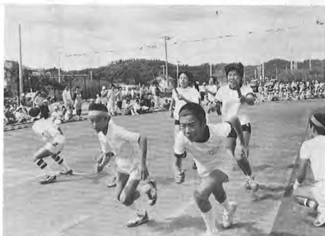
▲ バトンタッチ (三校対抗リレー)

十月十日、御宿町体育祭が開かれました。全町民参加を合言葉に、保育園児や小、中学校の児童、生徒から各地区老人クラブのお年寄りまでが、競技や遊戯に参加。秋空のもと、さわやかな汗を流しました。