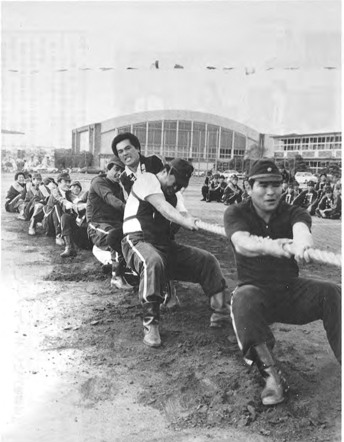
力感あふれる消防団対抗の綱引き(町体育祭)