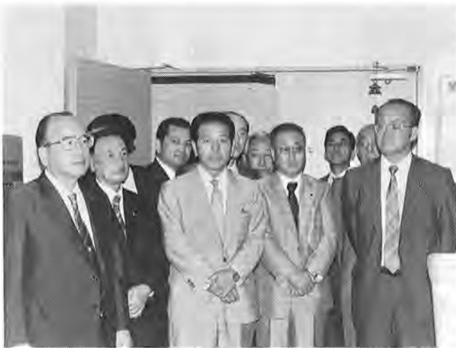
【写真】夷隅地区三市町を視察する沼田知事（左）

接その現地へ出かけ、説明を聞くもの。御宿町では、滝口町長が、これからの町づくりを中心に現状と将来計画について説明した後、次の三点を要望しました。