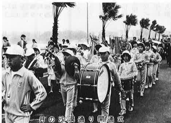
一月の沙漠通り開通式

日本人初の宇宙飛行、緊迫する中東情勢…：国の内外を問わず、さまざまな出来事が相次いだ一九九〇年。わたしたちの町でも、いろいろなことがありました。町では、「一九九〇年／町の十大ニュース」と題し、主な出来事を集めてみました。