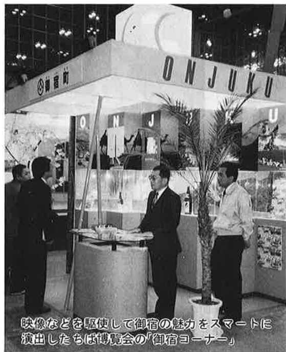
映像などを駆使して御宿の魅力をスマートに演出したちば博覧会の「御宿コーナー」