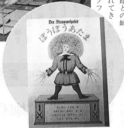
資料館に展示されている五倫文庫の教科書(左上)と日本語版「ボウボウアタマ」(上)

ルト市のシュトゥットガルトペーター博物館。この博物館は、ヨーロッパの有名な育児書(絵本)「ボウボウアタマ」