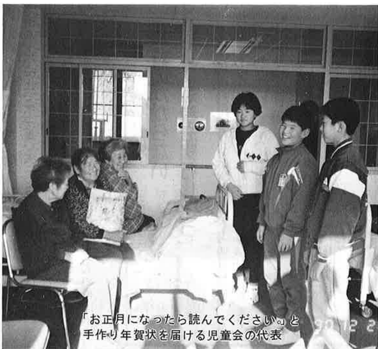
「お正月になったら読んでください」と手作り年賀状を届ける児童会の代表