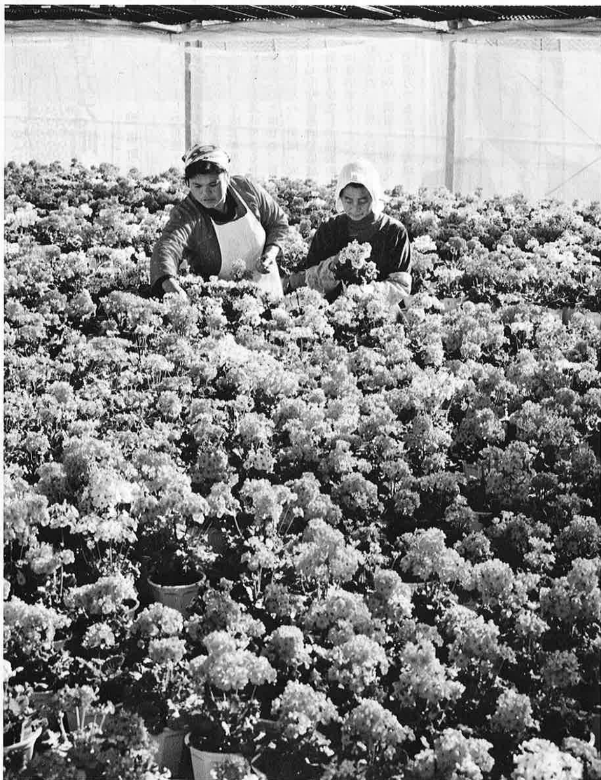
温室内はひと足早い春の香りが一花づくりに取り組む(上布施)