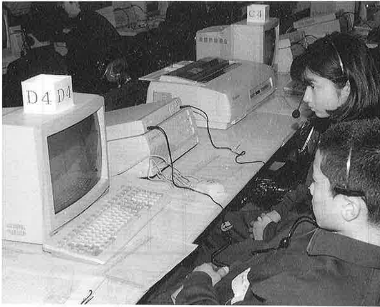
画面を見つめる生徒の目は真剣そのもの 「早く自由に使いこなせるようになりたいなあ」

す。このパソコン教室は、平成五年度から技術科で行われる情報基礎学習に先駆けて、パ