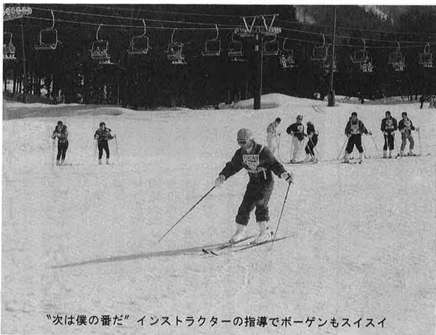
“次は僕の番だ” インストラクターの指導でボーゲンもスイスイ