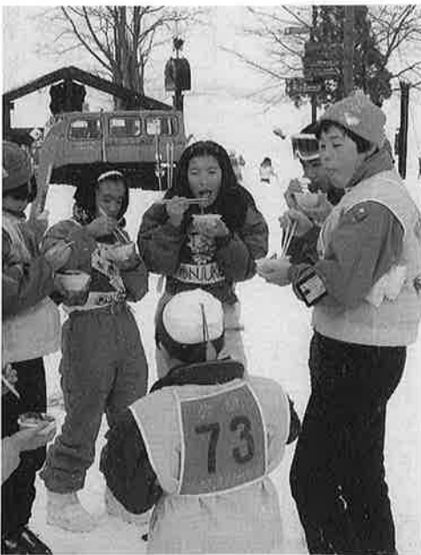
8 kmを滑べり終えて、ひと息おでんのサービス

私は、この野沢の人々との交流、一番の思い出になると思います。だって最後だったもの、この交流会。私が大人になっても、続くといいと思います。でもそのころには、変わっているだろうな。あの美しい自然も、真っ白な雪も。友達、これを機会に、たくさんつくれました。一生の友達としていきたいなあ、心はまだ少し野沢に残っているような気がします。