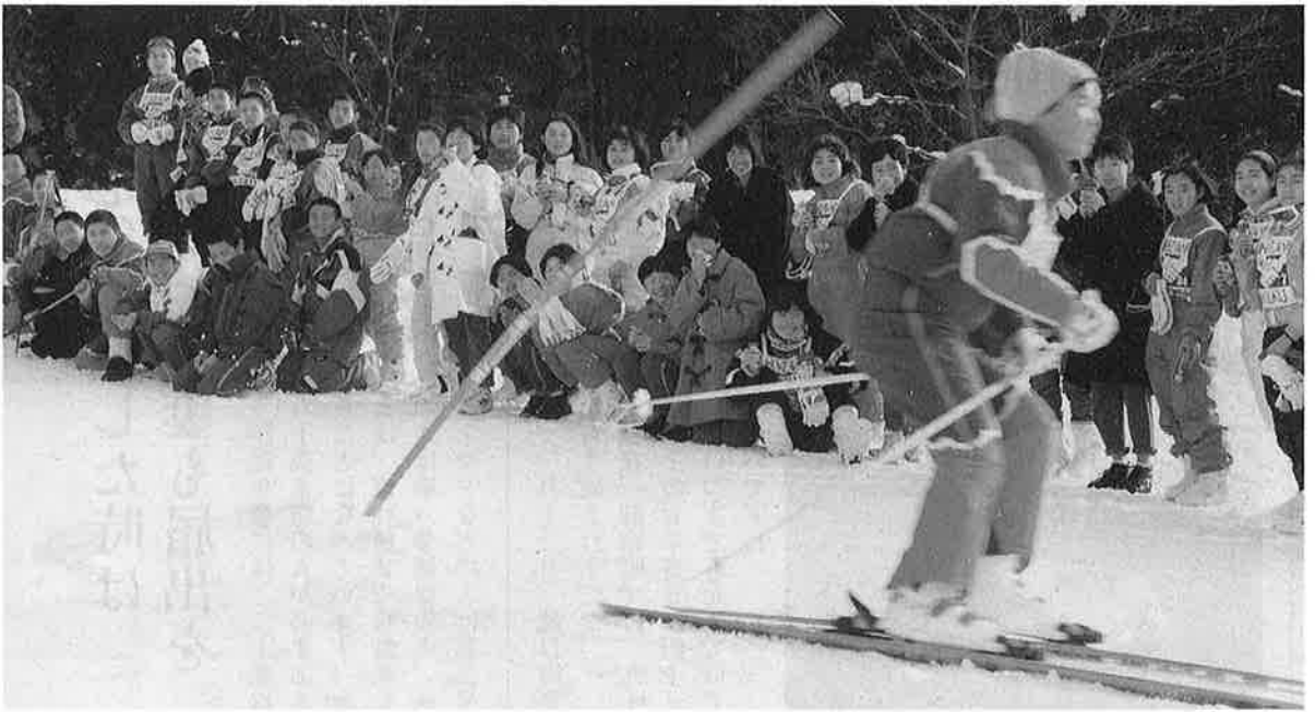
交換会では、野沢温泉中生徒のスキー試技「すごーい」と歓声が上ります。