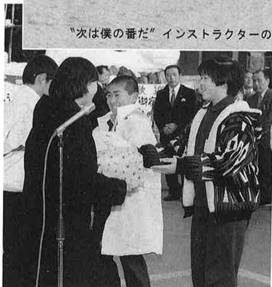
よろしくネ 記念品の交換でにっこり