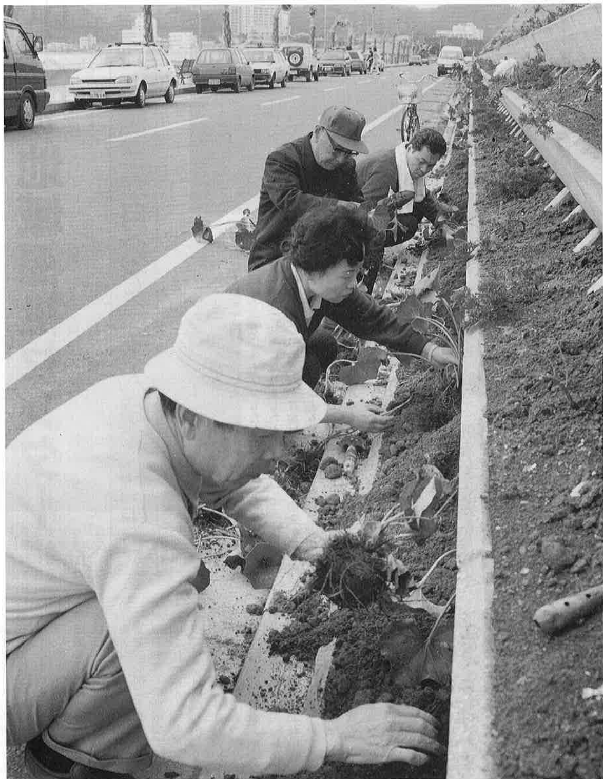
月の沙漠通りにツワブキを——9月には黄色い花が