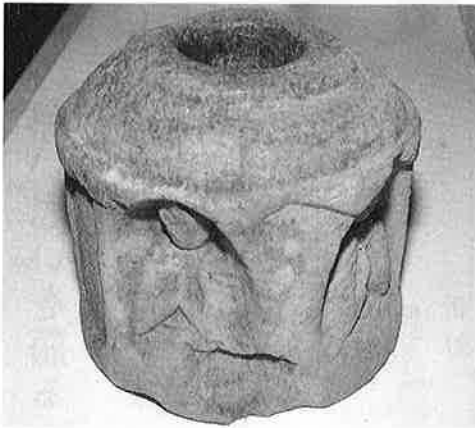
町歴史民俗資料館に展示されています

浄化槽をすでに設置済みの方は、費用等の関係上、すぐに合併浄化槽に設置換えできないということでも台所排水だけを処理する簡易浄化枘について補助金を交付しようとするものです。この浄化枘を設置された場合は、水の汚れの七十〜八十パーセントは除去されますが、一方で維持管理が非常に大切となります。枘の中に溜った沈でん物やろ材に付着した油分などを一カ月に一〜二回清掃除去しなければなりません。維持管理次第で浄化効果が半減するからです。雑排水浄化枘の設置についてその工費は一般家庭で、およそ三〜五万円程度かかると思われま