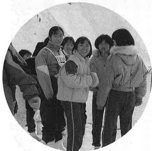
夏からの再会に話もはずみます

海の子が、雪山とスキーを体験する『海と山の子交流会』が、二月十二日から十五日までの日程で行われました。