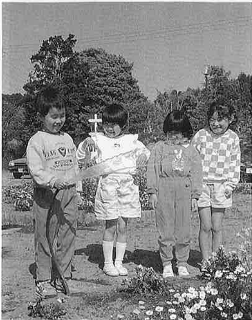
生活にかかせない“水”の安定供給を——

御宿町の水道事業は、当初 街地区域と夷隅開発B地区(現 布施・高山田地区を除く、市 在の御宿台)を給水対象とし