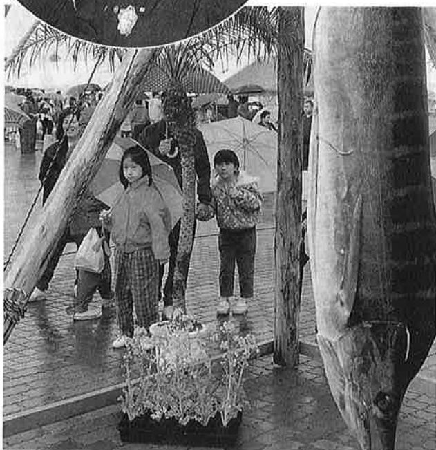
2m、100kgのカジキマグロがおさしみに—お魚ウィークス

月の夜は 海をみつめ 君は何を想うの せに乗って 歩きたいね ラクダに ゆらゆらと 夢のある町だね 御宿は 月の沙漠の町 御宿は