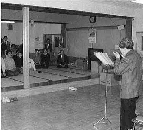
作業所内に美しいハーモニカの音が響きました

夷隅郡市福祉作業所（夷隅町）では、新入生三名を迎え四月三日に入所式を行いました。