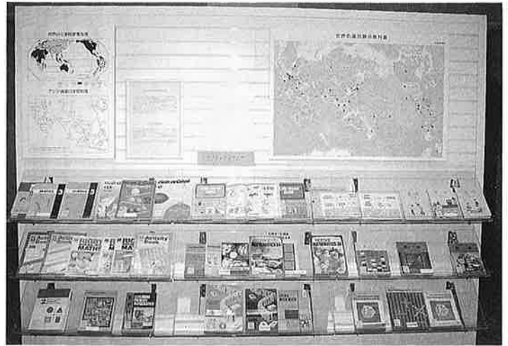
36カ国、100冊の算数の教科書が展示されています