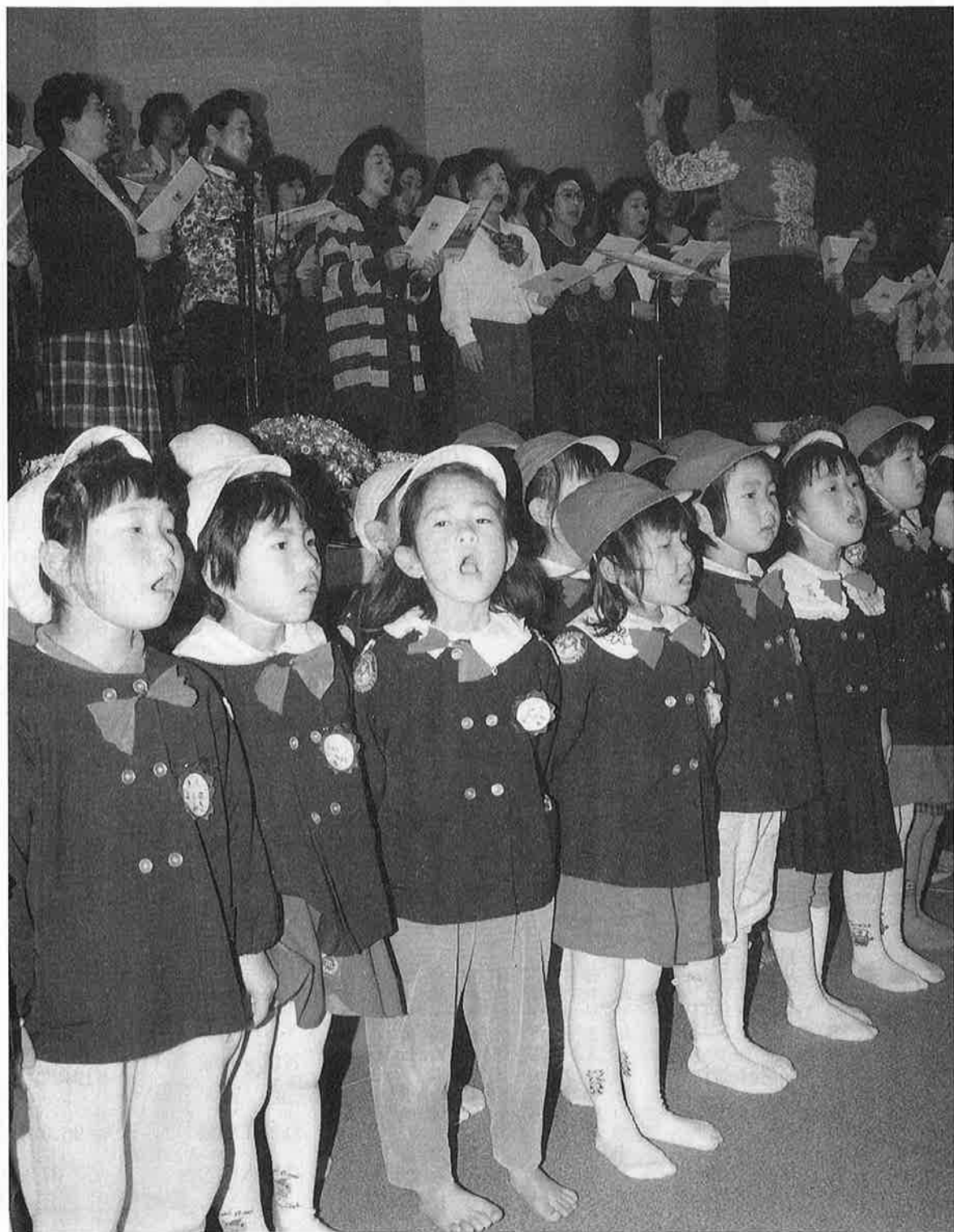
「御宿の歌」を大合唱——童謡大会——