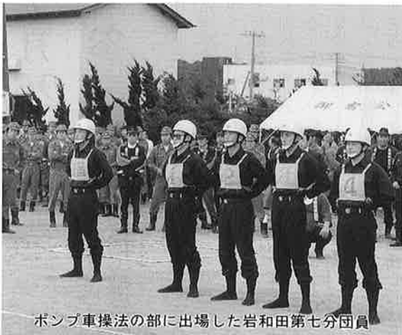
ポンプ車操法の部に出場した岩和田第七分団員