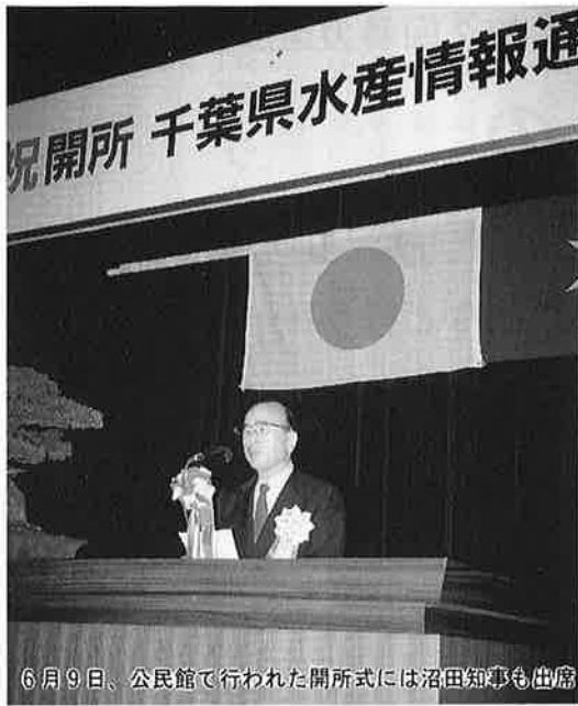
6月9日、公民館で行われた開所式には沼田知事も出席