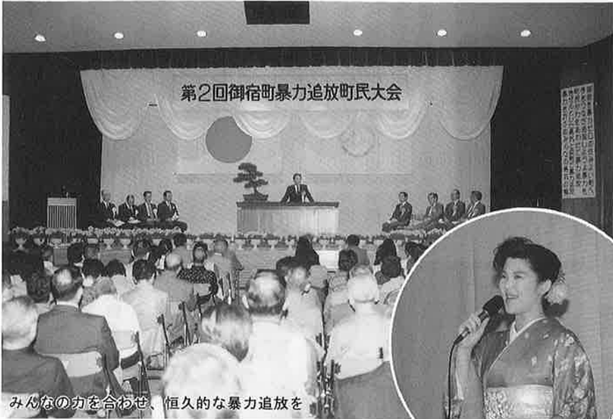
みんなの力を合わせ、恒久的な暴力追放を

私達の日常生活を脅かす不法行為や暴力は、暴力行為によるものや言葉や文字によるもの、相手を限定せず自分のとった行動が、誰かに迷惑を与えていたり、様々な形で存