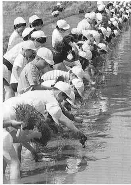
社会体験を通して豊かな人間性をはぐくみます——ふれあい農業から