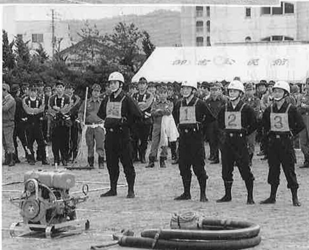
小型ポンプ操法の部では上布施第十分団員が出場、敢闘賞を獲得

消防団では、この大会に備え出場団員と団員が丸となり、仕事を終えた夜間や休日を通し、四月下旬から訓練に取り組みました。