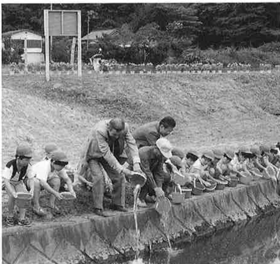
放流した錦鯉がいつまでも、わたしたちの目を楽しませてくれるよう、川をきれいに保ちたいものです

最近では、清水川のあちこ ちで大きく成長した錦鯉を見 かけることができるようです。 河川浄化のシンボルとして、 また私達の目を楽しませてく れる錦鯉を大切に守りたいも のです。また誤って釣り上げ てしまった場合には、川に放 してあげて下さい。