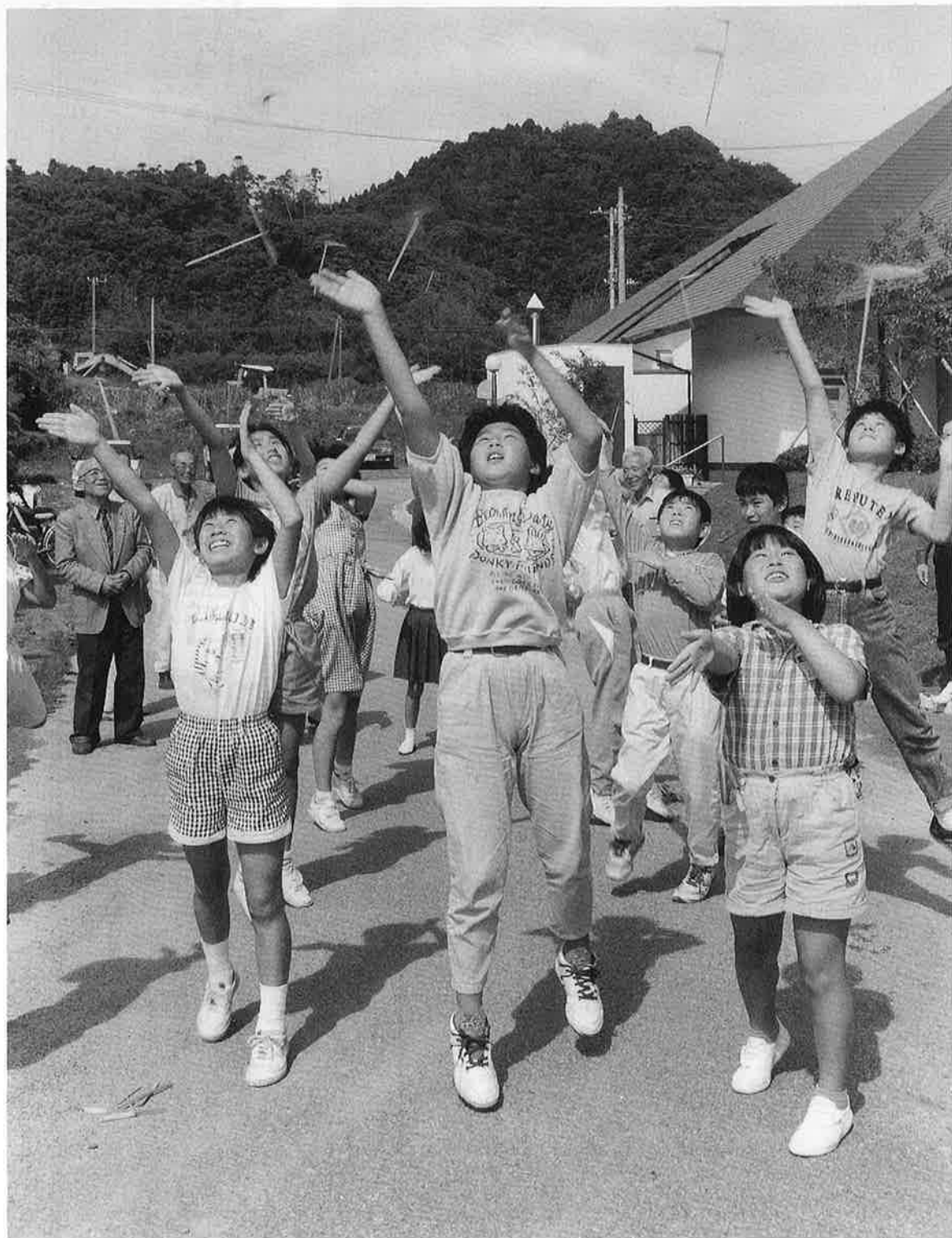
空高く飛び上がれ——お年寄りが先生で竹とんぼ作り