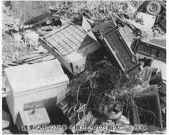
雑多なものが多く排出された粗大ゴミ回収