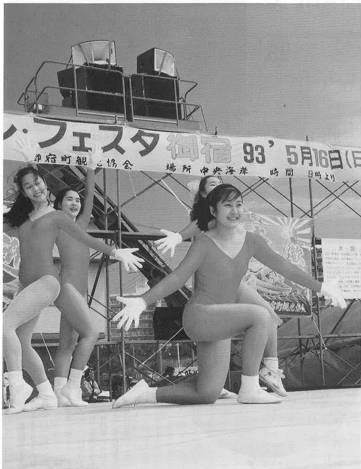
今年も盛り上がりをもせた海開き