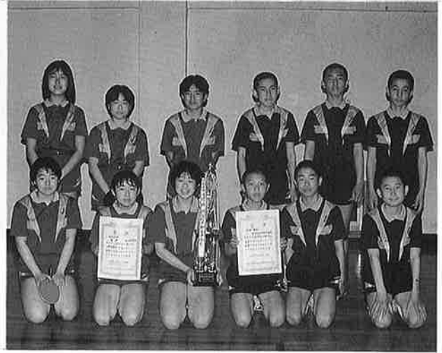
御宿中学校卓球部員