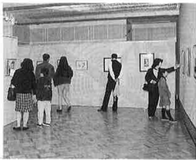
にぎわいをみせる月の沙漠記念館