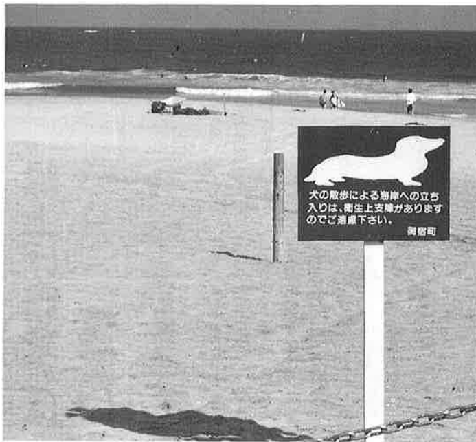
現在設置されている看板

いかがでしょうか。これは言うまでもなく、犬のふんによる砂浜の汚染の問題です。飼い主の方がきちんと百パーセント処理してくれば、このような事を考える必要はない。それが、なかなかできないから、このような条例を提案したいと思います。 町民の皆さんのご意見をお待ちしています。 環境衛生課