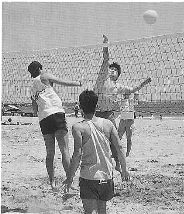
若さあふれるダンスを披露した女子大生（写真上） 熱戦が繰り広げられたビーチバレーボール大会（写真左）