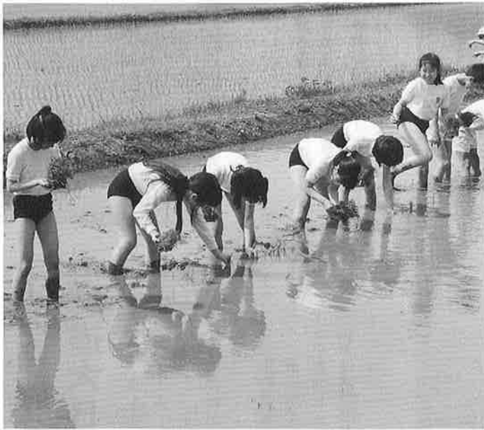
「お米が実るかなあ」一期待と不安のふれあい農業

五月十二日(水)、町では、町内の各小学校五年生を対象に、「田植えを体験する『ふれあい農業』」を昨年に引き続き実施しました。九十一名の児童が裸足になって、水のぬるむ水田におそろおそろ足を入