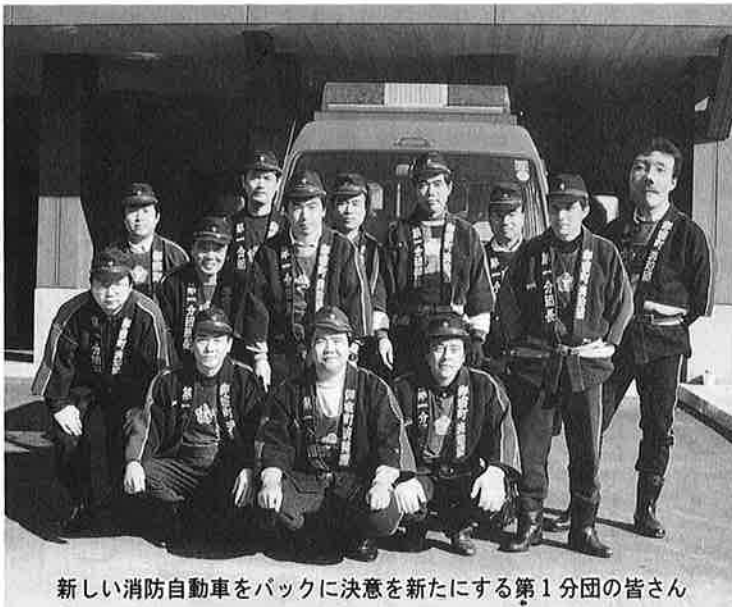
新しい消防自動車をバックに決意を新たに第1分団の皆さん