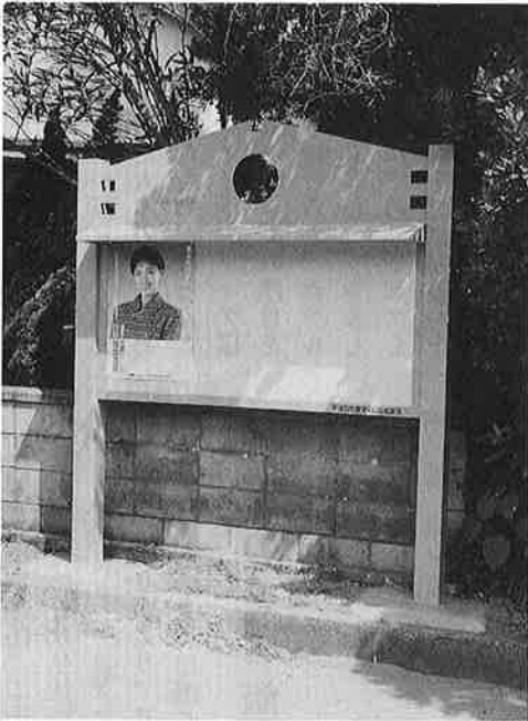
新町会館前の掲示板