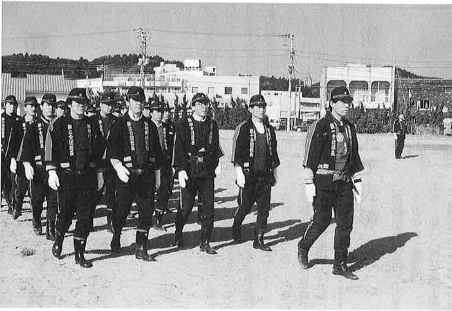
小 隊 訓 練

安心して暮らせる町づくりを支える、御宿町消防団の出初め式が、一月七日、須賀多目的広場で行われました。日頃、職業を持ちながら町の消防、防災のため訓練に励む消防団員の分列行進やポンプ操法の演技に、見守る多くの来賓から、賞賛の拍手がおこられました。