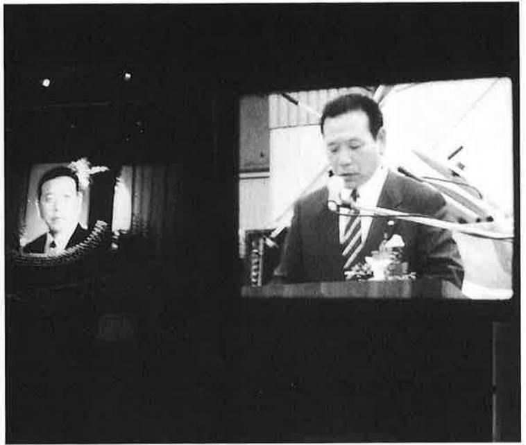
スクリーンにはありし日の滝口町長が