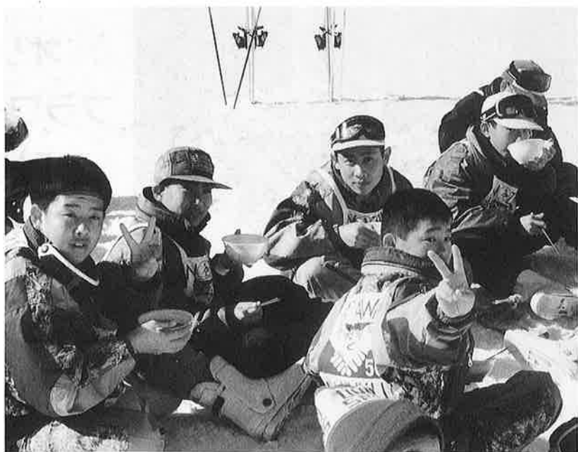
滑り終えてひと息、おしるこのサービス

二日目からは、いよいよスキー教室。スキーははじめてという生徒もいるにもかかわらず、一流の指導員の手ほどきで、わずか一日で何とか滑