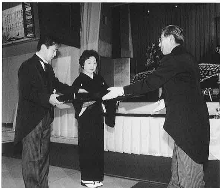
大谷助役から勲六等單光旭日章が伝達される