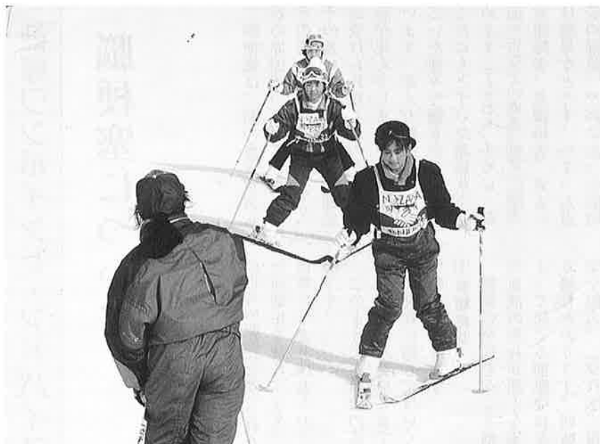
1 流の指導員によるスキー教室で技術もアップ

海の子が、雪山とスキーを体験する、海と山の子交流会が、二月十六日から十八日までの日程で行われました。交流十九年目を迎えた今年、