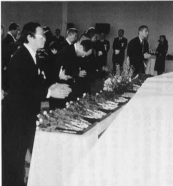
最後の別れを惜しんで献花を