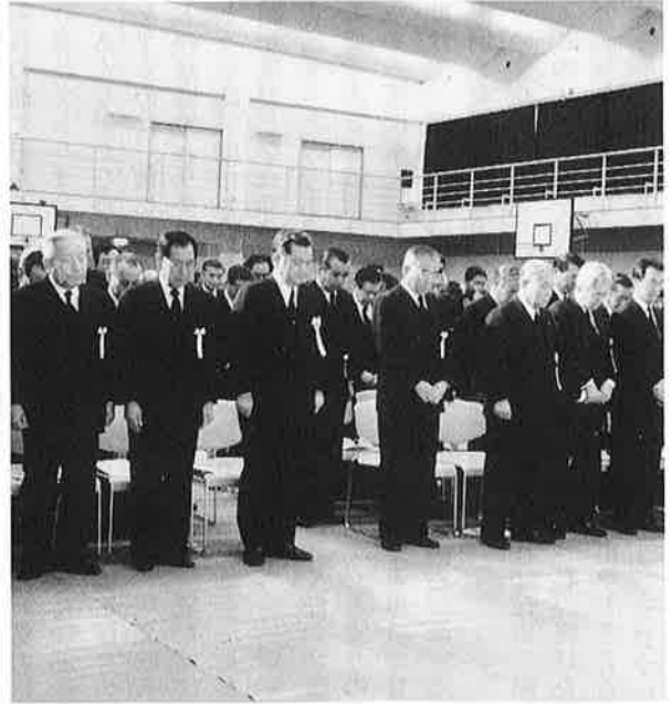
参列した800人全員で黙とうをささげる

が 見 ら れ ま し た。 町 民 が 次 々 と 献 花 に 訪 れ、 遺 影 に 手 を あ わ せ 別 れ を 惜 し む 姿 が 見 ら れ ま し た。