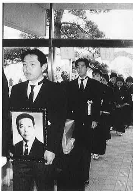
ご遺族に抱かれて遺影・遺骨が入場