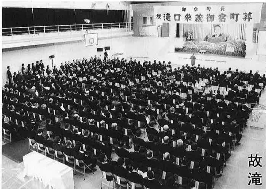
町葬には約800人の会葬者が訪れました