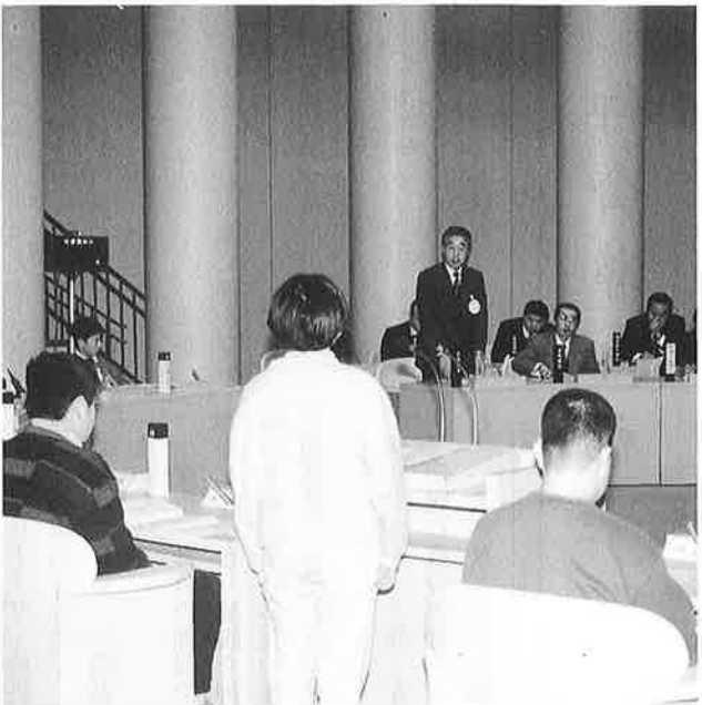
大人顔負けの議会が1時間半にわたって行われました

住民が集い、語りあう場としての新庁舎が完成したことを記念し、二月一日、子ども議会が開かれました。一日議員になったのは、町内の小学