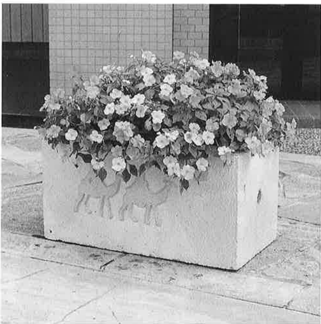
月の沙漠をモチーフにしたフラワーポット

町では、快適で美しい街並を整備する一環として、植栽事業を進めています。このほどオリジナルフラワーポット百二十基が完成しました。公園や遊歩道などお気付きになった方も多いと思います。この事業費は総額百二十万円。この内百万円は、「自治宝くじ」収益金の一部を充当する緑化推進コミュニティ事業の助成金を受けたものです。