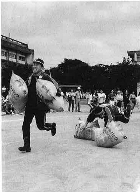
土のう運びリレー