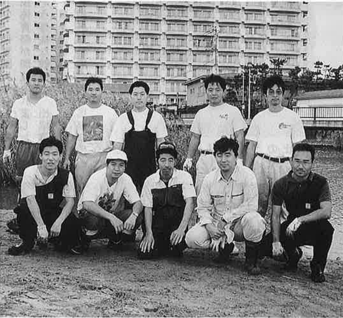
河川清掃に参加した商工会青年部の皆さん