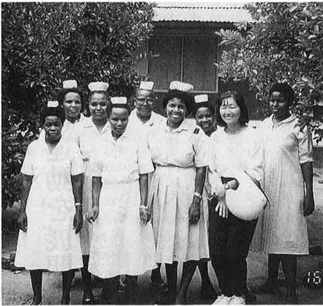
時には意見をたたかわし、時には看護について語りあった病院の看護婦たち