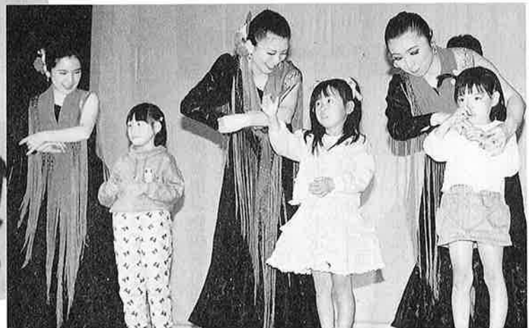
一緒に踊ろう ルンバ・タイム