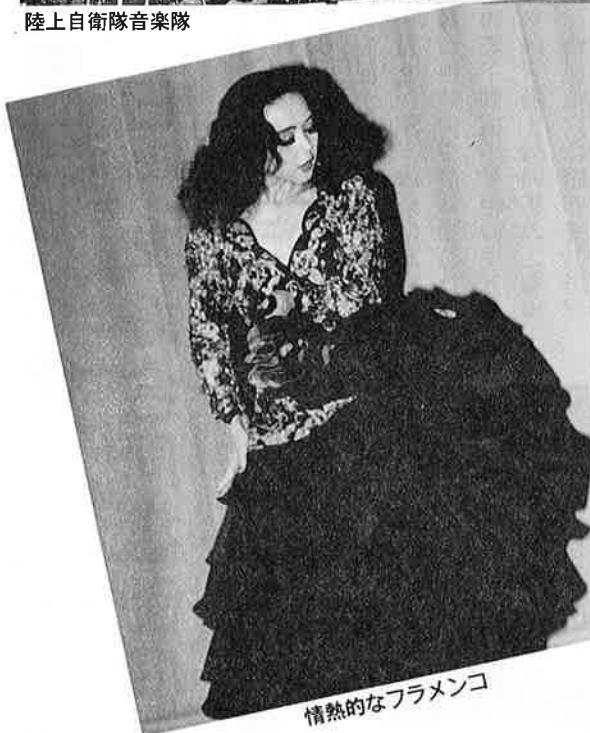
情熱的なフラメンコ

ンコダンスが行われました。テンポのある軽音楽と情熱的なフラメンコ。皆さんの熱演により楽しいコンサートとなりました。