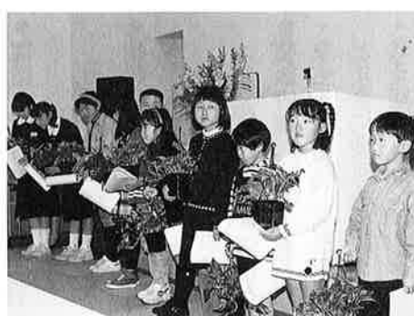
ポスター・標語のかわいい受賞者たち

○心豊かに人生を送るために このほか、PTAの皆さんによるバザーや保健・福祉に関するパネルや器具などの展示も行われ、盛り沢山の楽しい一日でした。