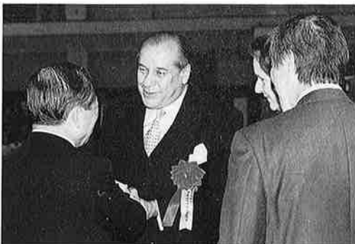
メキシコ大使も出席されました