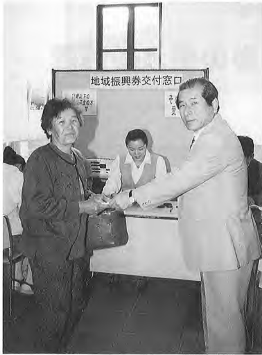
最初の地域振興券を交付する加藤町長