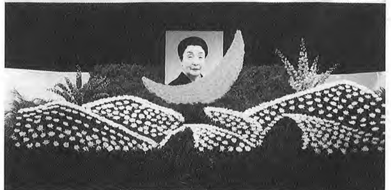
最後のお別れを惜しみ多くの参列者がありました