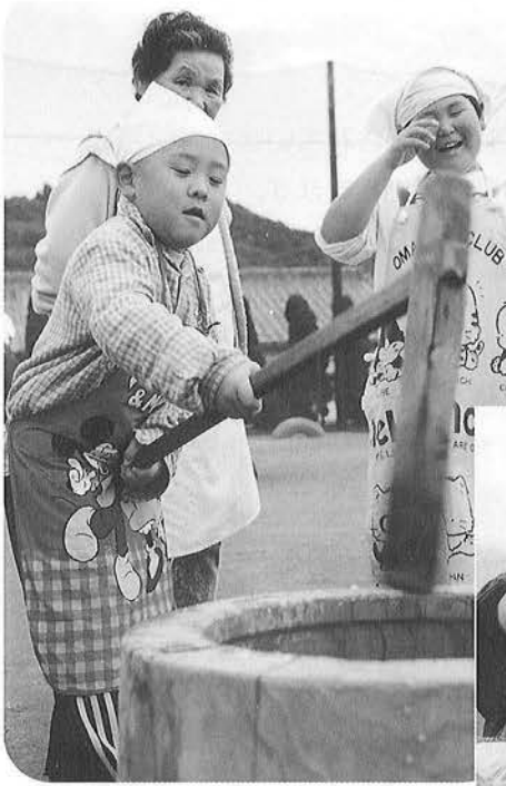
おいしいお餅はできましたか？