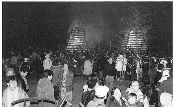
年末のイベントである渚の火祭りでは多くの観光客で賑わいます。