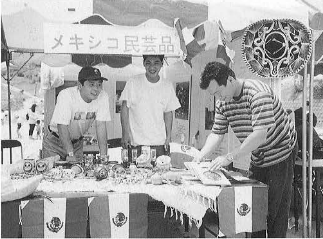
いろいろなメキシコの民芸品を取り揃えた「メキシコ輸入品フェア」