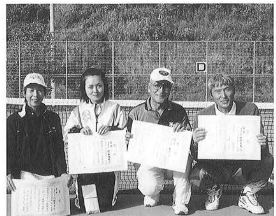
硬式テニス（ダブルス）の優勝者の皆さん。