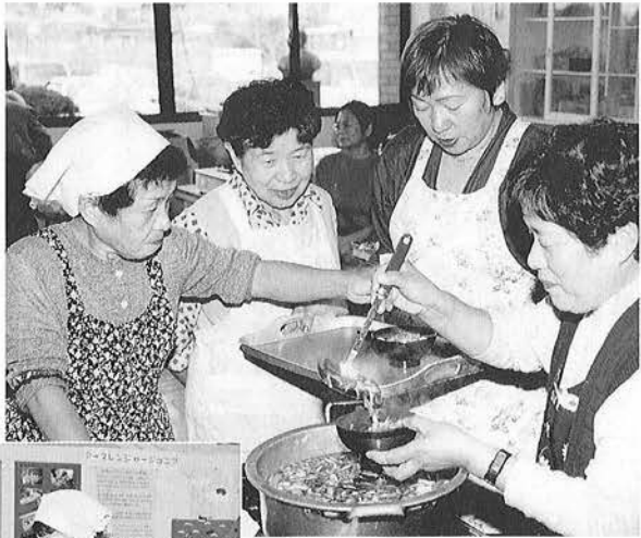
料理愛好会の皆さんによる手づくりソバ。試食会場は、たくさんの方で賑わいました。

十一月三日（祝）・四日（木）の二日間、町文化祭が開催され、様々な作品の展示や自慢の喉を発表する音楽発表会などが行なわれました。 当日は、料理愛好会の皆さんによるソバの試食会や陶芸展、また、繊細な技術がにじみ出た盆栽、ユニークにデザインされたひょうたんなどの展示、さらには、囲碁大会などが開催され、たくさんの方が自慢の作品を持ちよりました。