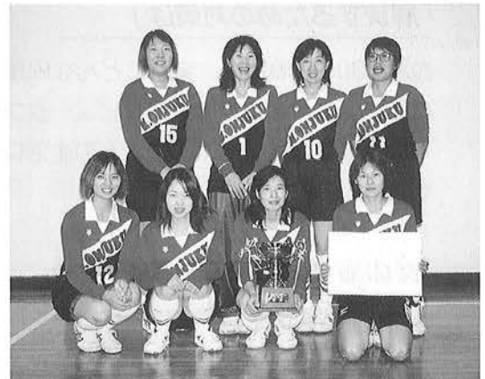
バレーボールでみごと優勝。マミーおんじゅくチーム。

文化祭にあわせ、町スポーツ競技大会が町営グラウンドやB&G体育館などで開催されました。 スポーツ競技大会は、スポーツを普及し、あわせて町民相互の親睦と融和を図ることを目的に毎年開催されています。 当日は、ソフトボールやバレーボール、また、剣道・卓球、さらには、軟式テニス・弓道の六競技が行なわれ、好評が続出しました。