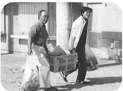
地道なボランティア活動により美しい海岸が保たれています。