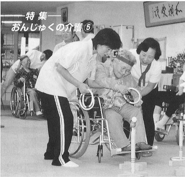
特集 おんじゅくの介護⑤

シリーズ五回目の今回は、九月十六日から受付を開始した「要介護・要支援認定申請」と「認定審査会」の状況についてお知らせします。