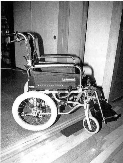
車イスで容易に移動できるように段差を無くしたり、床で滑らないようにコルク貼りにした住宅の様子

るように、室内の段差の解消や廊下や出入口を広くする、また、広くて使いやすいトイレ・浴室にするほかに、住宅を新築する際に将来、身体機能が低下して住宅を改造する場合に備え、あらかじめ設計上の工夫をしておく改造がしやすくなります。