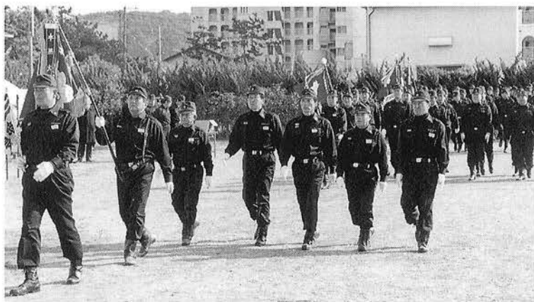
町消防団本部の皆さんを先頭に行なった分列行進の様子

町消防団の出初式が、一月七日に須賀多目的広場で行なわれ、各分団員総勢一四五名が参加し、地域防災における新たな決意を固めました。