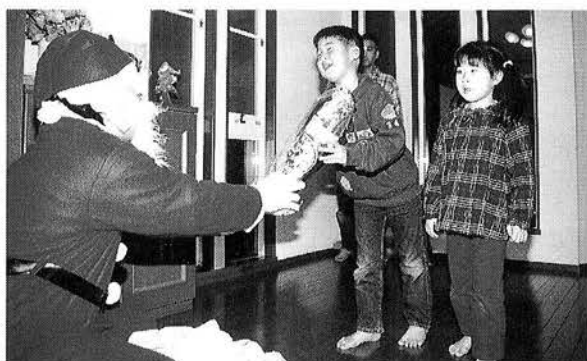
サンタクロースの登場に、子どもたちは大喜び

これは、商工会青年部がサンタ訪問事業を行なっている埼玉県毛呂山町を視察し、その事例を参考に、青団連の事業として取り入れたものです。サンタクローズの衣装を着た青団連の皆さんは、十二班に分かれ、六四軒の家庭(一七名)にプレゼントを届けました。