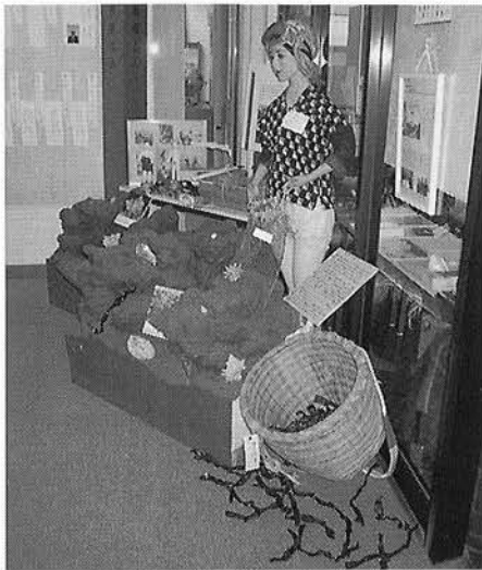
海女の衣装を着ることができる 体験コーナーも好評でした。