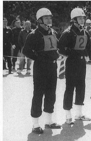
各分団ともに日頃の訓練の