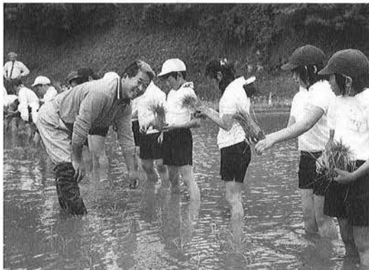
1,690㎡の水田に苗を植えました