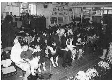
岩和田保育所の入所式の様子