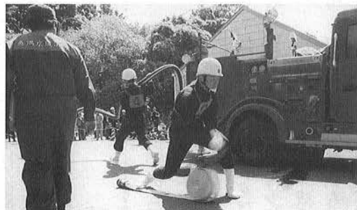
すばやくホースを延ばして、53メートル先まで連結させます