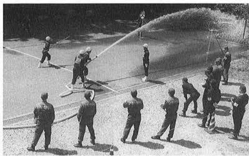
火のもとを想定し、実際に水を出して競い合います