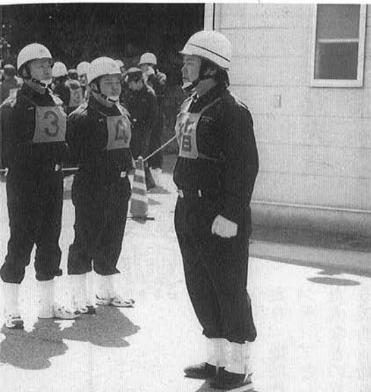
成果を発揮し、迅速な操法技術を披露しました