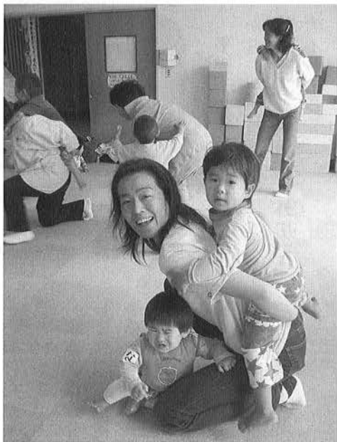
約30分間の運動あそびを行うパワフルキッズ