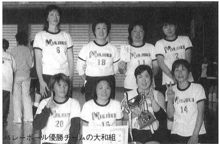
バレーボール優勝チームの大和組

秋晴れのなか、各種目とも楽しいなかにも真剣勝負が繰り広げられました。結果は下記のとおりです。