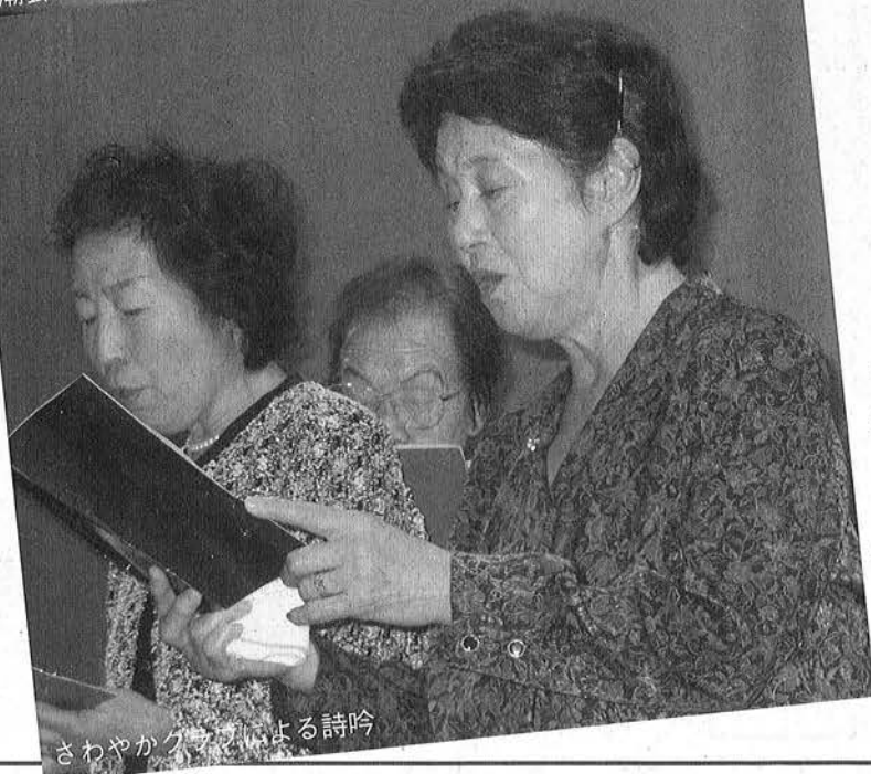
さわやかクラブによる詩吟