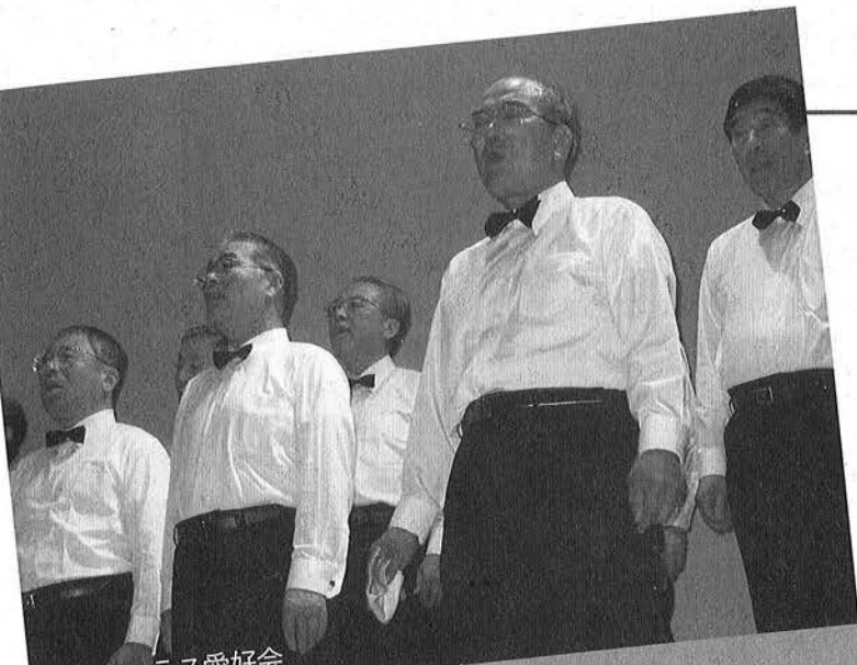
御宿コーラス愛好会