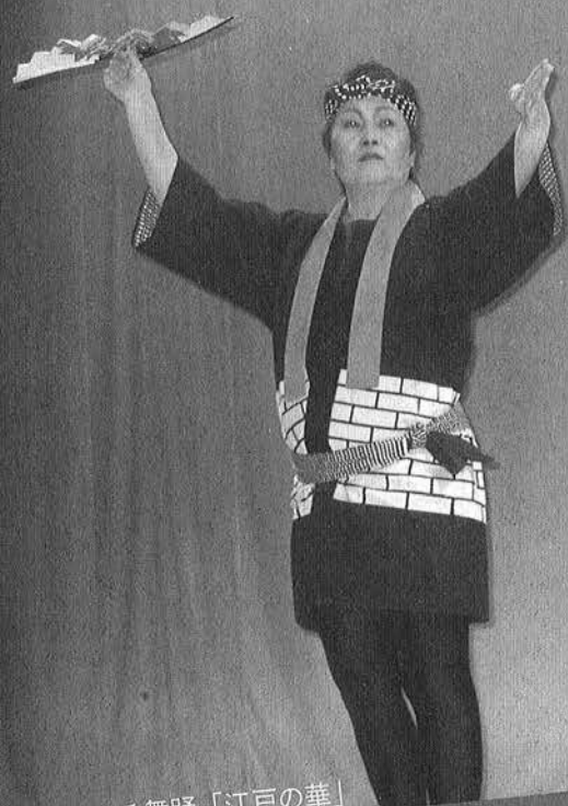
春潮会による舞踊「江戸の華」