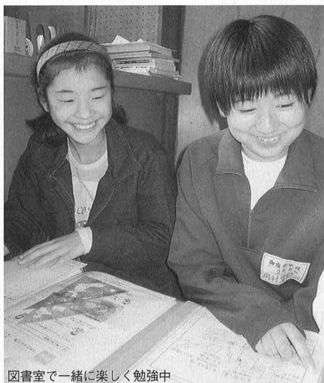
図書室で一緒に楽しく勉強中

町内をまわって、御宿のいろんな顔が見れてとても良かったです。良い勉強になりました。これからはこの経験を活かしていきたいです。いろいろな経験をさせていただいた役場の皆さん、ありがとうございました。