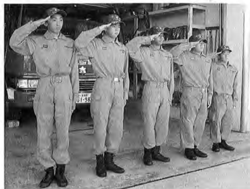
オレンジ色の服に身を包まれ、少し緊張している中学生消防士