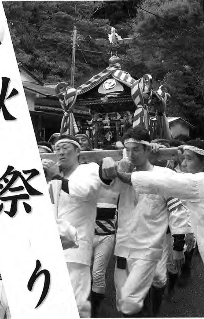
大宮神社祭礼の宮出し

春 日神社と大宮神社のお祭りが9月末に行われました。豊作、豊漁を祈願し、それぞれの神社から神輿が出され、渡御が行われました。春日神社祭礼の年番区は浜区。各地区からの協力もあり、さまざまな色の半纏が神輿を囲みました。