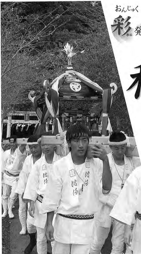
春日神社祭礼の宮出し