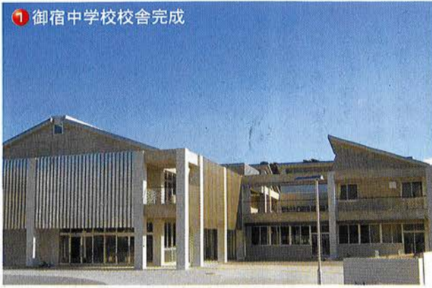
① 御宿中学校校舎完成