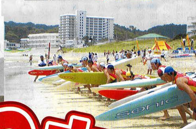
⑦ 全日本種目別 ライフセービング大会開催