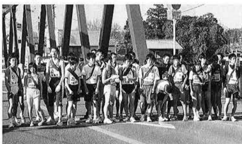
夷隅郡市一周駅伝大会