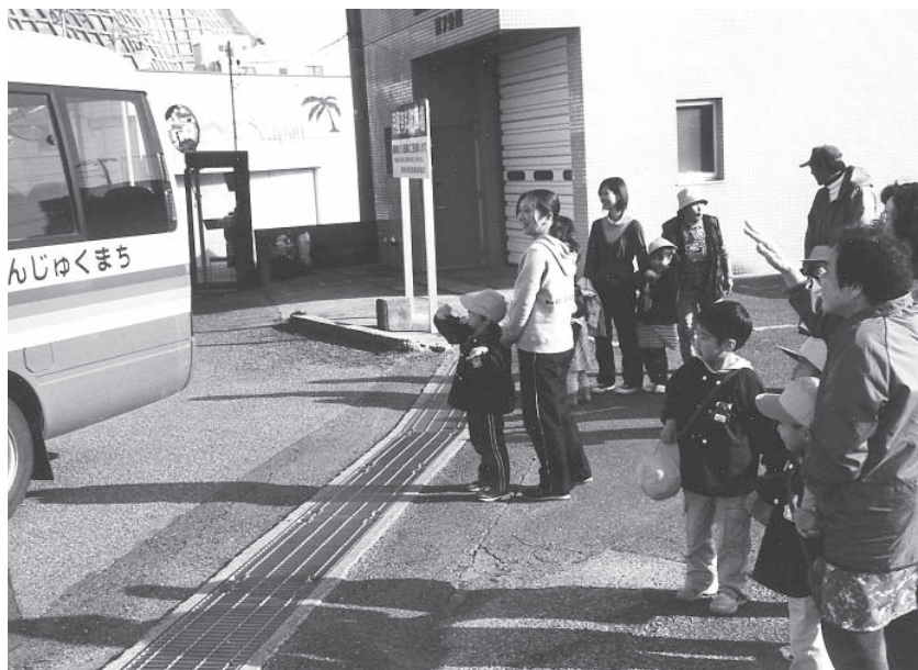
▲岩和田地区の子供もバスで保育所まで

御宿保育所では、入所年齢の構成は変わりませんが、岩和田地区の児童が新たに加わりました。みんな活発で、先生方は大変ですが、多くの友達と接し、スクスクと成長していくことを期待します。