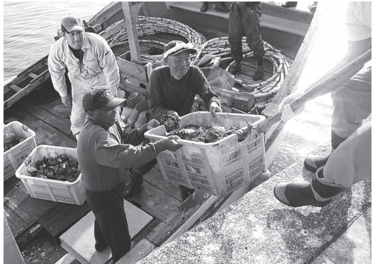
▲地場産業であるアワビの種苗放流により限りある資源の維持・増殖に努めます

農業振興においては、農作物への被害を最小限に抑え、安定した生産が営めるよう、有害鳥獣駆除対策として、イノシシの一斉捕獲や電気柵の設置のため、449万1千円を計上しました。観光振興では、観光施設の整備のため、1,470万円を計上したほか、イベントや各キャンペーンの宣伝強化のため、750万円を計上し、集客の向上を目指します。