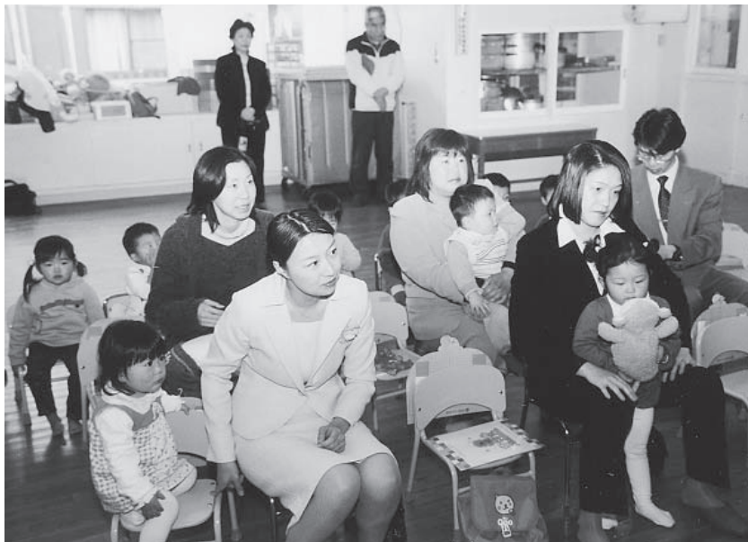
▲御宿の子も岩和田の子もみんな一緒に入園しました