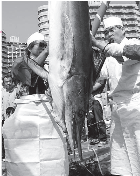
▲約 2m のカジキマグロがあっという間に解体されました

順延のため、当初予定していた魚のつかみ取りや月の沙漠童謡大会は行われませんでした。イベントは大盛況となり、会場にきたお客様は、春の思い出を刻んだことでしょう。