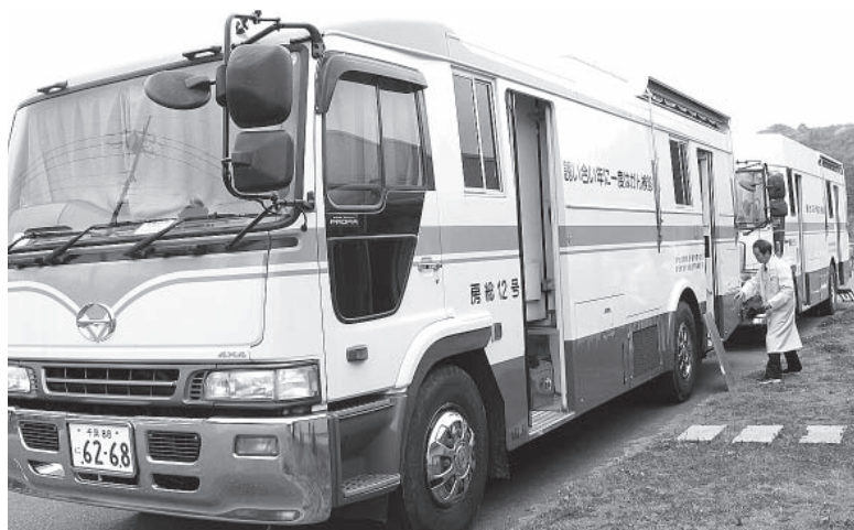
▲各世代に適応した検査や検診、予防接種を実施します

更にゼロ予算事業として、地域ぐるみの声かけ運動や公用車への「パトロール中」ステッカーの表示により防犯対策を推進します。