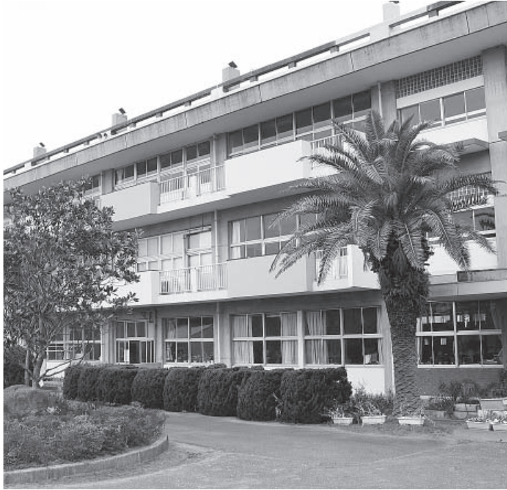
▲御宿小学校の大規模改修工事に取り組みます

御宿小学校の校舎及び屋内運動場の耐震補強、大規模改修工事に2カ年に渡り、1億6,000万円を計上しました。また、中学校屋内運動場の雨漏り改修工事に200万円を計上し、生徒達が安心して学べる環境づくりを整備します。