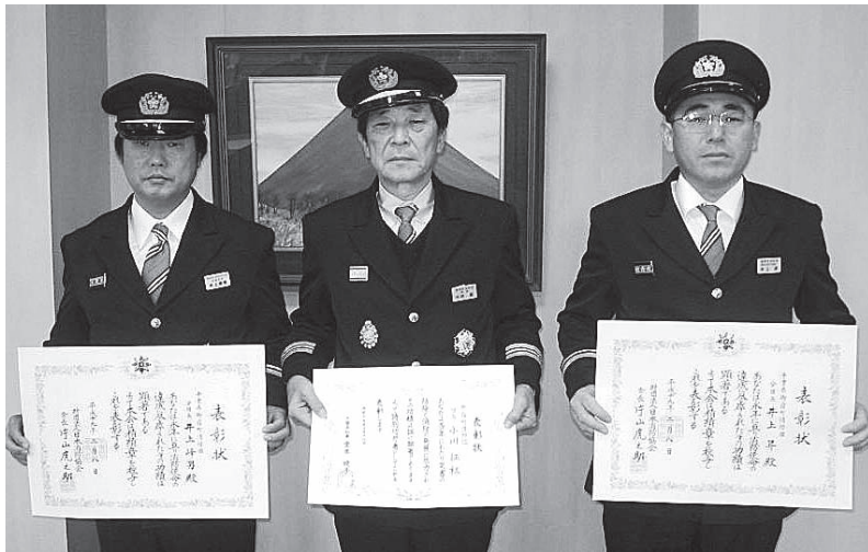
▲左から井上訓練部長、小川団長、井上分団長