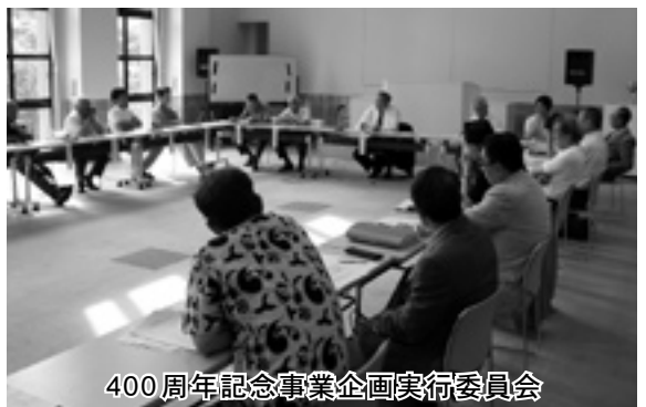
400周年記念事業企画実行委員会

私たちの体にも400年の時を経て、こうした祖先のこころ根が受け継がれています。これからも大切に伝えていきたいものです。