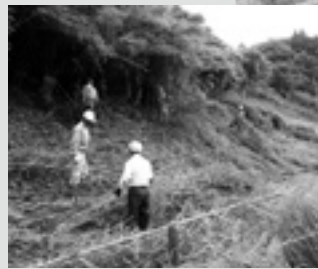
～高山田地域保全会～

高山田地域保全会では、地域の資源および環境を守るため、様々な活動を行っています。7月6日には菜の花用地として予定されている西琳寺十字路。7月26日には、桜の植樹予定地である天神谷の草刈りを行いました。当会では今後ため池のヘドロ除去や菜の花の種まきなど、地域のあらゆる自然環境保全に努めていきます。