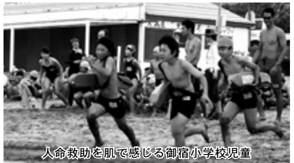
人命救助を肌で感じる御宿小学校児童

先人が400年前に行った献身的な救助活動、この心を学び、史実に触れる一端として、御宿小学校では全校児童を対象にライフセービング体験を行いました。