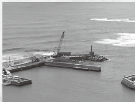
岩和田漁港基盤整備事業 7,843万円