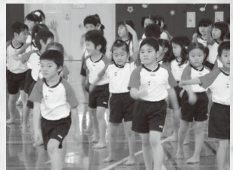
子育て支援事業 1億8,083万円