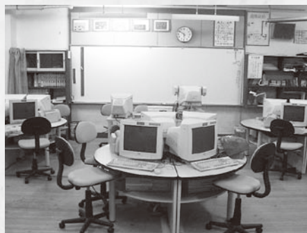
小・中学校校費 5,221万円