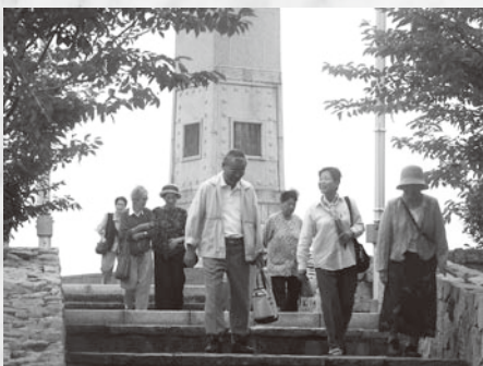
高齢者等福祉費 1億1,150万円

実質赤字比率 町の会計が黒字の場合「-」 連結赤字比率 町に関わるすべての会計が黒字の場合「-」 実質公債費比率 町の収入に対する借入金の割合 将来負担比率 町の収入に対する将来負担すべき負債額の割合 資金不足比率 水道会計資金の状況（資金不足が無ければ「-」）