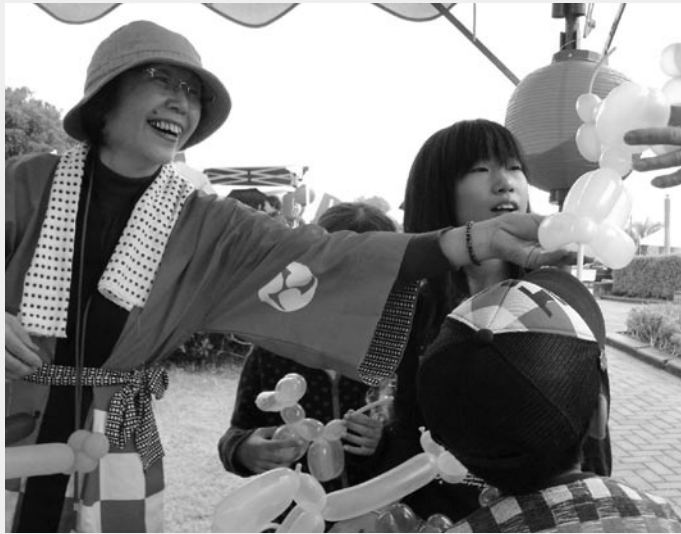
(風船工房：御宿マジッククラブ) 犬やウサギなどのバルーンアートを無料で配布。 「もう100個以上作りました。皆さんに喜ばれています」