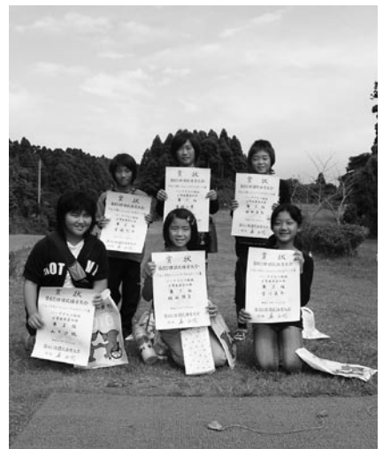
▲小学生の部入賞者