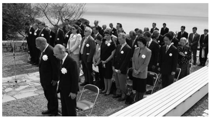
▲サン・フランシスコ号の乗組員に対する黙とう

1609年9月30日、スペイン船サン・フランシスコ号がメキシコに向かう途中、荒天により岩和田沖に座礁しました。当時の岩和田村民は、乗組員373名中317名を救助したという偉大な史実があります。 昨年度は、その史実からちょうど400年にあたり、様々な記念イベントを実施しました