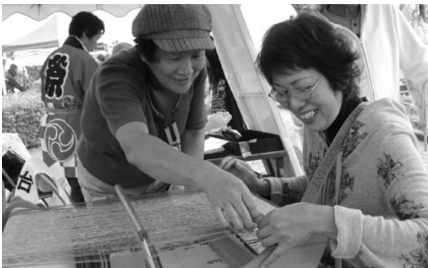
▲織物を体験することができました

今後も、消防・防犯活動や子ども会への参加など様々な活動について、各区との連携を図りながら協力的体制の充実を図っていくことが重要となってきます。