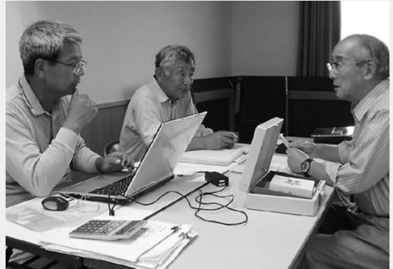
イベントの企画から準備作業まで、実行委員会 と各サークルグループで取り組んできました。