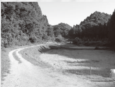
中山間地域総合整備事業 811万円

総務費は、定額給付金事業等により前年度と比べ約1億7千万の増額。民生費は、医療費の増加などから国保や介護などの特別会計への繰出金の増加により約4千万円の増額となりました。衛生費は、大原聖苑の焼却炉改修による火葬業務負担金の増加により約1千万円の増額。その他の項目についても、教育費（平成20年度に小学校耐震補強工事を実施）を除き増額となりました。