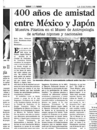
▲メキシコでも報道されました