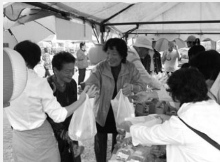
(中山間実行委員会による販売) → 「販売する楽しさを実感しています」 御宿米をはじめ、自然薯や柿、栗など、 地元産品を販売。さつまいもの試食 も好評でした。