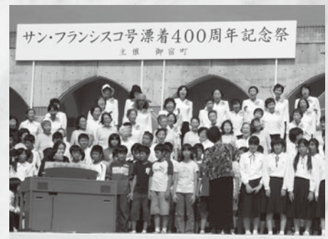
日西墨400周年記念事業 804万円