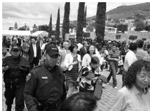
▲御宿町からの訪問を3,000人以上のテカマ・チャルコ市民が歓迎

ロ出生の地、プエブラ州テカマ・チャルコ市を訪れました。400年前にドン・ロドリゴ・デ・ビペロ一行を救済した町から来た私たちが多くの市民が歓迎してくれました。