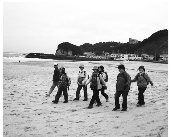
▲300名の方々の参加があった駅からハイキング

また、JR主催の駅からハイキングも同日に開催され、毎年参加されている方からは、「コースの途中で様々なイベントがあり、今年是一段と楽しいです。」という言葉も。