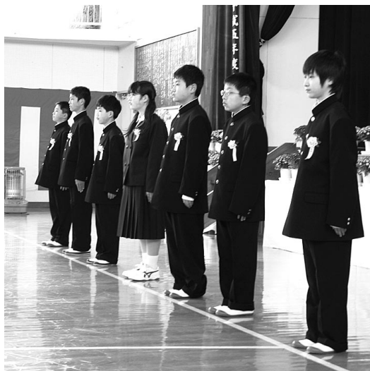
▲布施小卒業生による在校生へのお別れの言葉

御宿中学校の卒業式が3月11日に行われ、今年には58名の生徒が、思い出のたくさんつまった学校から巣立ちました。 卒業生代表挨拶では、3年間の思い出のほか、これまでお世話になった、先生方やご父母の方々へ感謝の言葉が送られました。 卒業式終了後には、卒業生一同による合唱が行われ、学習成果発表会で披露した『あなたへ』が歌われました。合唱の最中、これまでの思い出がよみがえり、涙が止まらなくなる生徒の姿