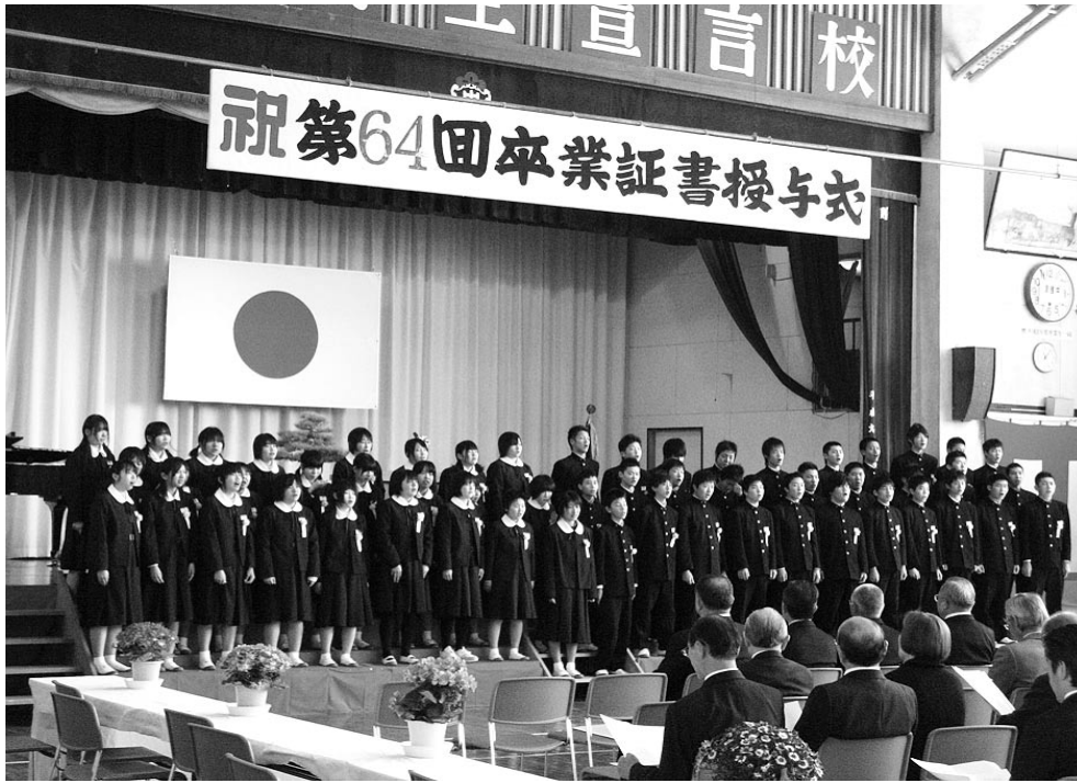
▲御中卒業生による卒業の歌