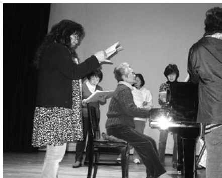
▲『詩(うた)の心』をつかみ、美しい混合合唱に！ (御宿コーラス愛好会)