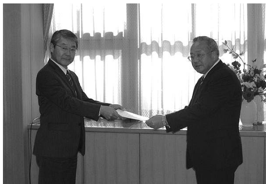
▲県まちづくり担当部長より同意書をいただきました

景観行政団体とは、景観計画の策定、景観法に基づく景観行政を担う団体のことを示し、基本的には、指定都市、中核市、都道府県が景観行政団体となります。また、指定都市及び中核市以外の市町村は、都道府県との協議・同意により景観行政団体となることが可能とされています。(景観法第7条)