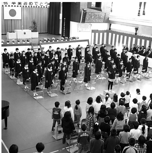
▲在校生からお祝いの歌をもらう御小卒業生

御宿中学校の卒業式が3月11日に行われ、今年には58名の生徒が、思い出のたくさんつまった学校から巣立ちました。 卒業生代表挨拶では、3年間の思い出のほか、これまでお世話になった、先生方やご父母の方々へ感謝の言葉が送られました。 卒業式終了後には、卒業生一同による合唱が行われ、学習成果発表会で披露した『あなたへ』が歌われました。合唱の最中、これまでの思い出がよみがえり、涙が止まらなくなる生徒の姿