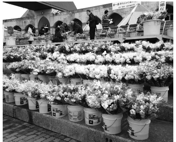
▲一足早い春を演出した、スプレーストック

御宿の魅力がたっぷり詰まった春のイベント、『春一番おんじゅく海の花祭り』が、2月20日に月の沙漠記念館前広場で行われました。当日は、ステージ上に敷き詰められた、スプレーストックの無料配布のほか、観光協会によるカジキマグロの解体やすもん汁の無料配布、中山間実行委員会によるそば打ち実演・販売など、多くの地元住民により、様々な企画が行われ、訪れた2千人の方々を満喫させました。