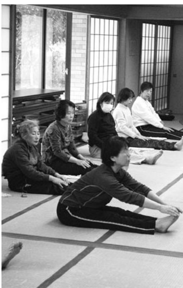
▲ヨガで心と身体をリラックス (御宿ヨーガクラブ)

そこできつと新たな「心の充実」や「生きがい」などを見つけることができ、また、そこから自分の可能性がより大きなものへと広がることでしょう。