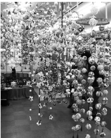
▲花やまり、伊勢えびなど、種類も豊富なつるし雛

そのコースの1つとなっていたのが『おんじゅく屋』のつるし雛、『おんじゅくまちかどつるし雛めぐり』は、2月17日から3月3日までの期間で開催されました。町商工会婦人が1年かけて作成したものをあわせ、合計6万個のつるし雛が町内協賛店を彩りました。期間中は、1万人を超える方が来訪され、かわいい雛にそれぞれ癒されている様子でした。