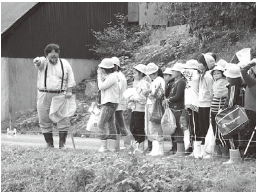
▲教育の一環として自然観察会を実施

また、小学校5年生を対象に「自然観察会」を年に3回実施し、観察を通して自然を理解し、自然環境を守る意識の高揚を図ります。