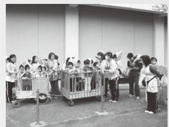
▲先生方に連れられて避難する岩和田保育所の子どもたち

開始から点呼終了までそれぞれ10分以内に完了。先生方の的確な誘導により子どもたちは迷うことなくスムーズに行動してました。 また、5月6日には大津波を想定した訓練（津波の到達には猶予がある想定）も行われました。