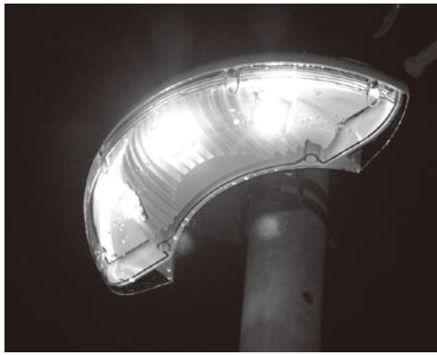
▶明るく省電力なLED型防犯灯