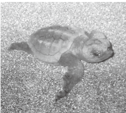
▲海を目指す御宿の浜でふ化したウミガメ

産卵場所への保護柵の設置など、皆さまの協力を得ながら、ウミガメの故郷である貴重な浜辺の保護に努めます。