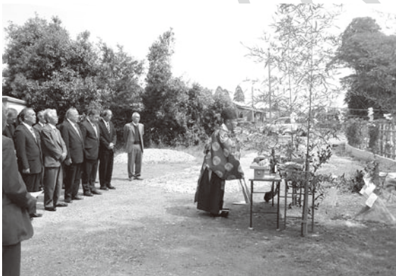
▲中山間総合整備事業の安全を祈願

実谷・七本、上布施地区の生産率が低い農地について区画整理や水路整備を行う中山間地域総合整備事業は、平成22年度中に地権者による地協議が整い、今年度より具体的な区画整理工事に着手します。