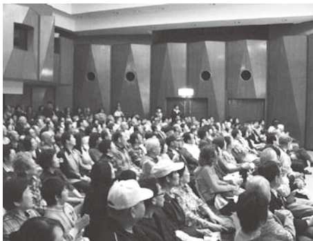
▶立ち見が出るほど大盛況

音楽隊「パシフィックトレンドズ」による60年代のメロディーは、楽器の生の演奏と英語によって奏でられ、人によって懐かしく、また人によっては新鮮に聴こえているようにした。 隊員と観客とが一緒に楽しむ姿や溢れる笑顔がとても印象的で、60代の女性からは「私たちの青春の頃の曲が多く聴けて、とても楽しめました。」など、多く称賛の声を頂きました。 300人を越える観客は公民館大ホールから溢れ、ロビーにまで達するほどの大盛況。多くの方が最後の曲まで聴まれ、帰り際には次回開催を望む声をたくさん頂きました。