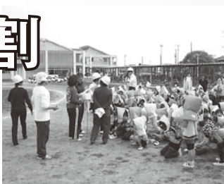
▲中学校のグラウンドで点呼を取り避難完了

小学生が保育所の子どもたちの手を引いて御宿中学校に避難するもので、30分以内に避難は完了し、子ども達の落ち着いた行動に先生方は感心していました。