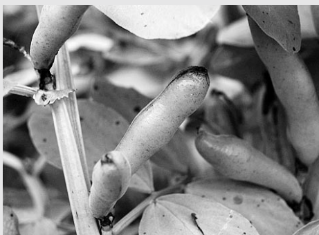
▲空に向かってさやを伸ばすソラマメ

平成22年度における御宿町個人情報保護制度の開示、訂正等の請求はありませんでした。