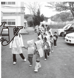
▲御宿保育所の子どもたちは小学校へ避難

岩和田保育所の子どもたちも防災頭巾をかぶり、先生方に連れられて、旧岩和田小学校の高台へと避難しました。